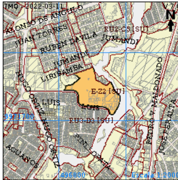
Gráfico No. 1