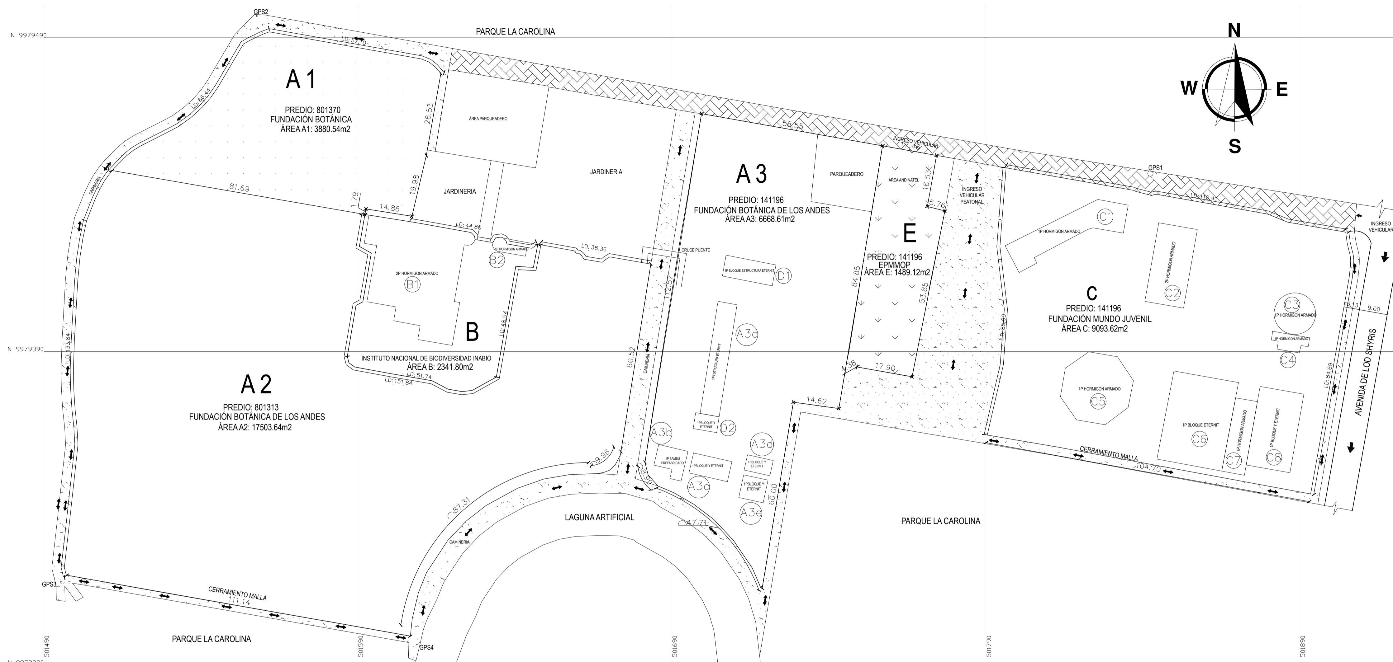
LEVANTAMIENTO TOPOGRAFICO ZONA 17 SISTEMA DE REFERENCIA ESPACIAL DISTRITO METROPOLITANO DE QUITO SIREC-DMQ ESCALA: 1:750