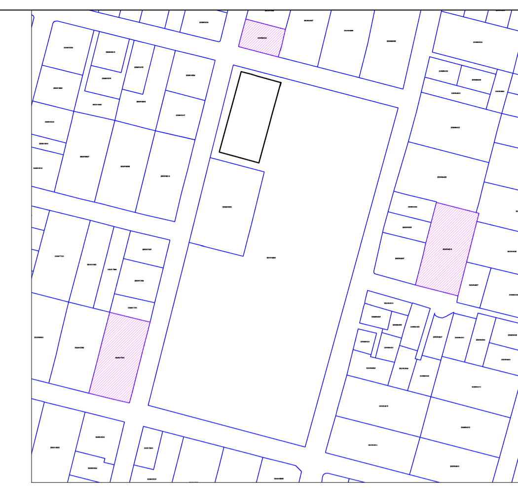
UBICACION ESC 1 / 2000