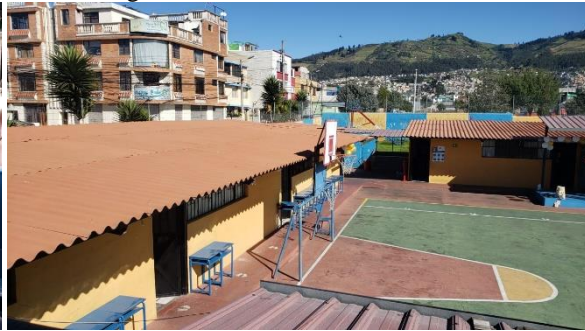
Fotografía 2 áreas exteriores.