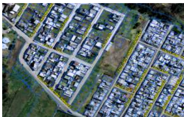
Grafico No. 1

Zona Metropolitana: ELOY ALFARO Parroquia: LA MENA Barrio/Sector: TARQUI 1 MENA 2 Dependencia administrativa: ADMINISTRACIÓN ZONAL ELOY ALFARO Uso de suelo: (RU2) Residencial Urbano 2