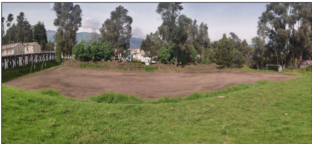
Fotografía Nro. 1 : Cancha de microfútbol (tierra)