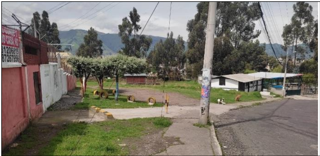
Fotografía Nro. 2 Predio Nro. 567636