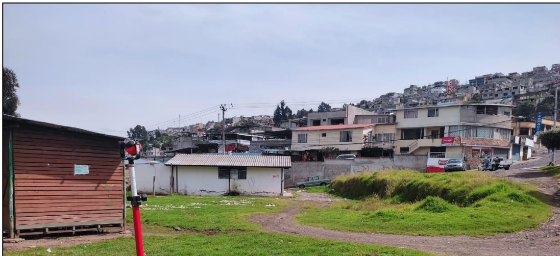
Fotografía Nro. 3 Construcción madera