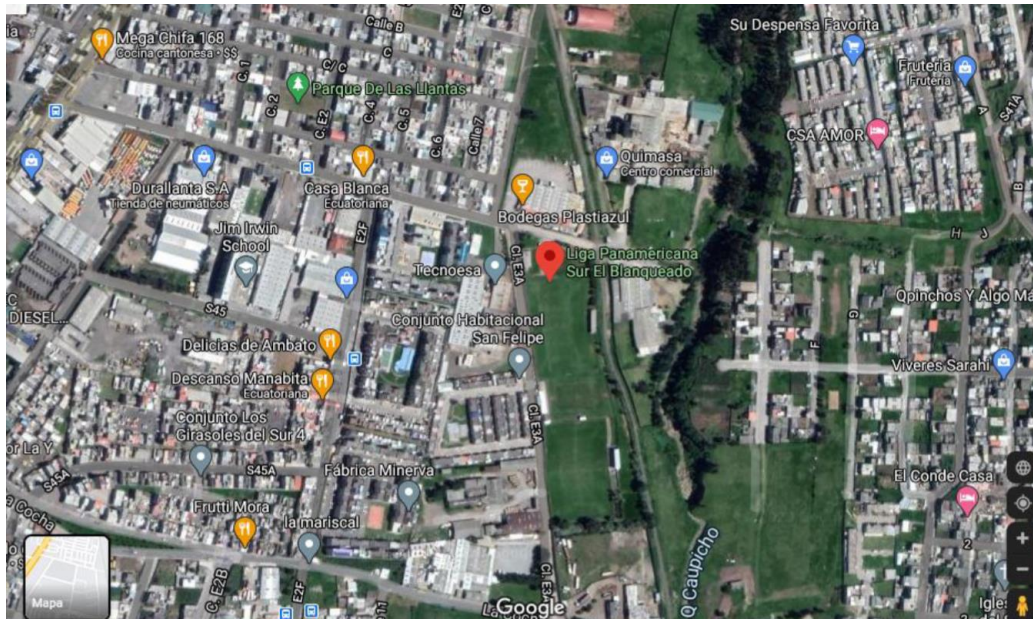
Imagen de Google Maps del predio solicitado

en su disciplina deportiva como baloncesto, ecuavóley y fútbol, en sus diferentes categorías: masculino y femenino. El predio referido es utilizado específicamente para los torneos de baloncesto, ecuavóley y fútbol en el que intervienen todos los equipos filiales.