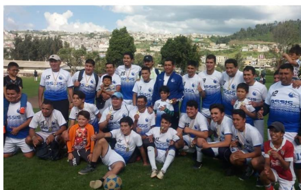
Imágenes de actividades deportivas