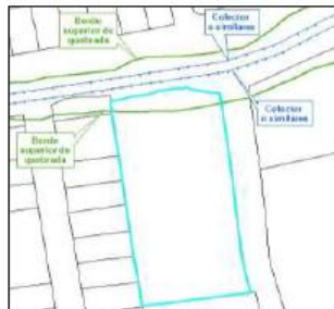
Ilustración 9 Valoración de fajas de terreno con colector o similares

Para estos casos se aplicará la siguiente expresión matemática: Vad = VAIVA + 0.30 * Saf