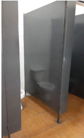
Cubículo de urinarios sin división