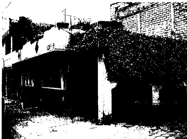
FAJA DE POSIBLE ADJUDICACION