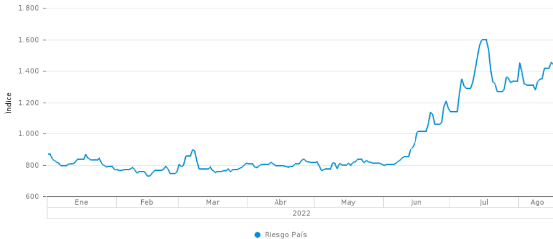
Imagen No. 4: Riesgo País 2022