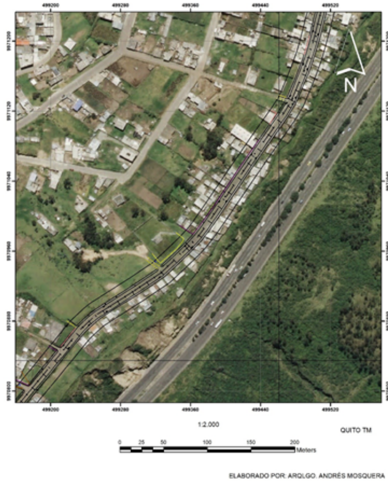
Fig. 5. Cartografía del Qhapaq Ñan con el trazado vial propuesto por la AZEA, en el sector Vista Hermosa de las Antenas.