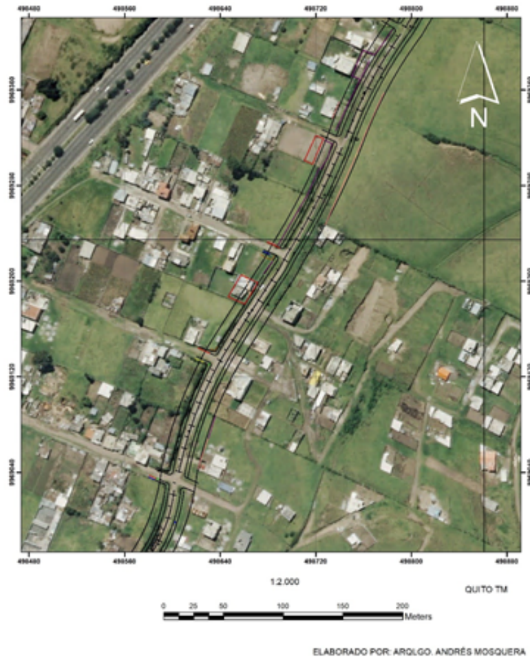
Fig. 3. Cartografía del Qhapaq Ñan con el trazado vial propuesto por la AZEA, en el barrio Cumbres Orientales.