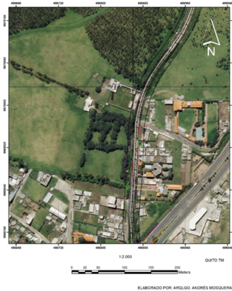
Fig. 4. Cartografía del Qhapaq Ñan con el trazado vial propuesto por la AZEA, en el sector La Ludoteca.