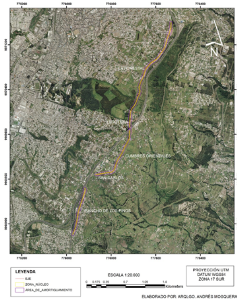
Fig. 1. Cartografía de las secciones del Qhapaq Ñan ubicadas en la Administración Zonal Eloy Alfaro.

Al recorrido asistieron delegados de varias instituciones del Municipio, entre ellas: Administración Zonal Eloy Alfaro, EPMMOP, Quito Turismo, Secretaría del Territorio, Instituto Metropolitano de Patrimonio.