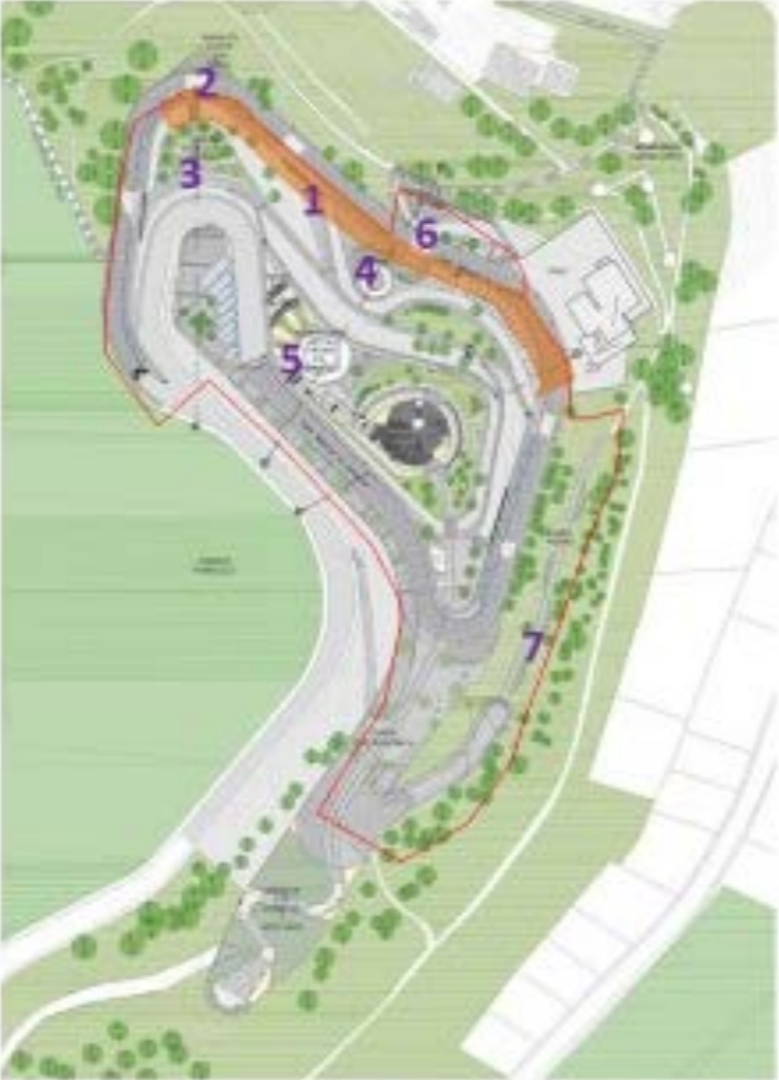
Camino de La Libertad