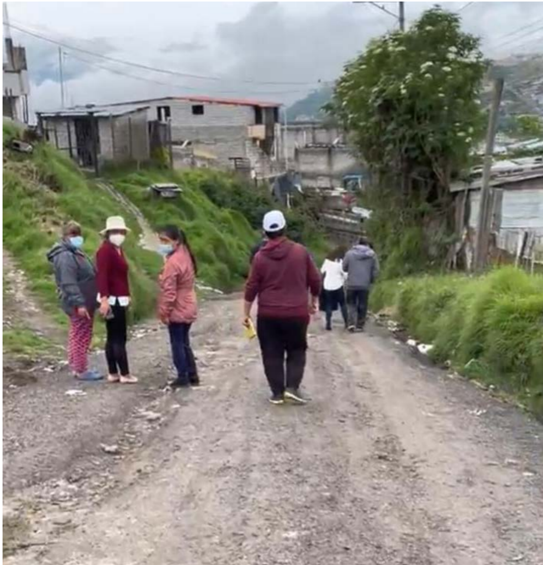
Camino del Inca