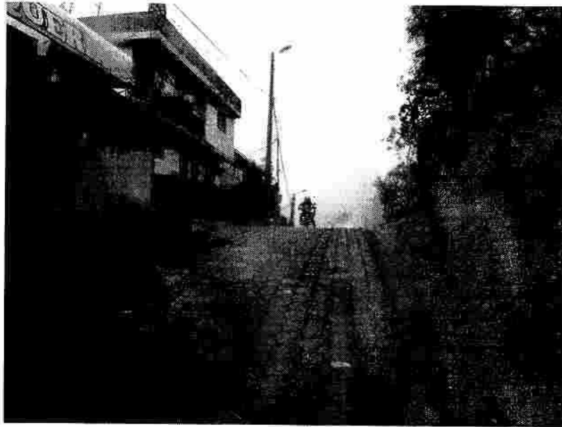
Pasaje S/N 4