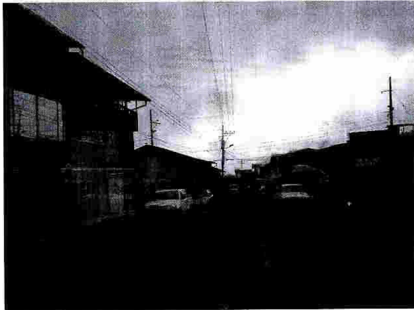
Calle S/N 1