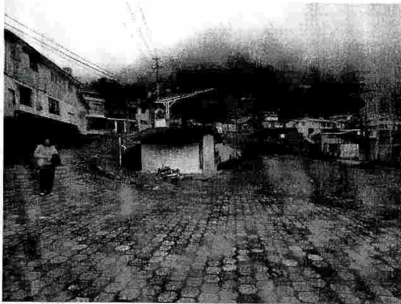
Calle Eugenio Espejo y S/N 3