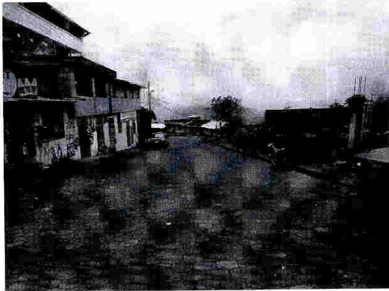
Vía a Nanegal