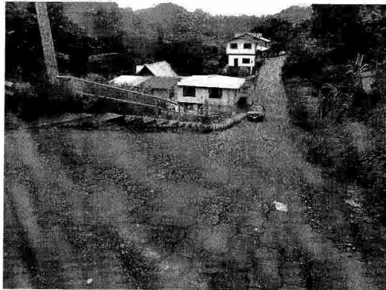
Pasaje Los Sauces