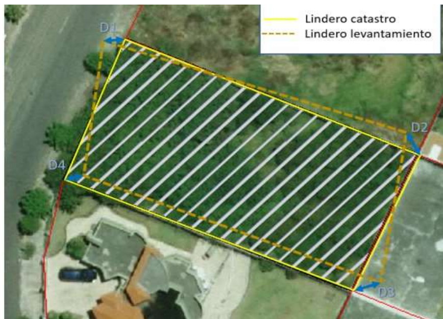
Figura 5: Discrepancias entre el linderos del levantamiento y la cartografía catastral

Como se puede apreciar en la figura anterior, las diferencias entre los levantamientos presentados y la cartografía catastral o cartografía base disponible por la DMC, pueden ser verificadas de manera expedita mediante el uso de herramientas de dibujo CAD o SIG, que permitan dimensionar las discrepancias existentes entre los distintos vértices identificados que se encuentren no coincidentes (D1, D2, D3, D4). Una vez cuantificadas las diferencias se determina el promedio de las mismas y se lo compara con la tolerancia establecida (0.33 metros - Urbano; 2 metros - Rural). Siempre y cuando la diferencia promedio sea inferior a las tolerancias planteadas, el administrado, podrá incluso, aceptar la definición preliminar disponible en la base de datos catastral de su predio y con ello también evitar procesos de edición gráfica dentro del Sistema SIREC-Q, haciendo más expedito el proceso de expedición de la cédula catastral para regularización.