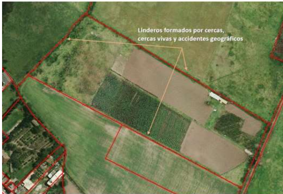
Figura 3: Linderos rurales consolidados por cercas y cercas vivas

Adicionalmente, de acuerdo a lo planteado en el presente proyecto de reforma, en su artículo IV.1.172, los límites de accidentes geográficos, específicamente los bordes de quebrada, permiten diferenciar y categorizar a nivel catastral y cartográfico, los bienes de uso público respecto a los bienes de dominio privado, como se ejemplifica en la Figura 4.