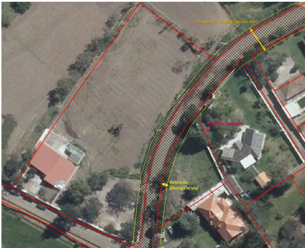
Figura 7: Afectaciones que limitan el uso del predio más no su titularidad (afectación vial)

Para el caso particular de proyectos de ampliación vial, de acuerdo a la regulación urbanística siempre se genera un área de afectación y que se detalla dentro del Informe de Regulación Metropolitana correspondiente a un retiro del lindero por efectos de una eventual ampliación vial. Sin embargo, dicho retiro no implica cesión de la titularidad del inmueble, sino que simplemente es una regulación que no faculta la utilización del suelo para procesos constructivos, es decir, es una limitación en el uso del mismo.