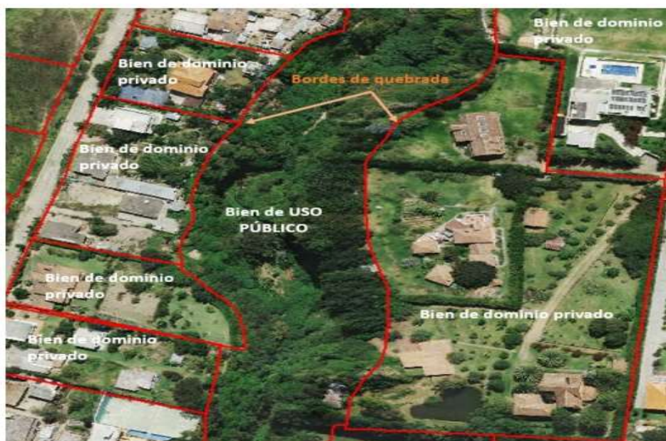
Figura 4: Bienes de dominio privado (inmuebles) – Bien de uso público

Adicionalmente, de acuerdo a lo planteado en el presente proyecto de reforma, en su artículo IV.1.172, los límites de accidentes geográficos, específicamente los bordes de quebrada, permiten diferenciar y categorizar a nivel catastral y cartográfico, los bienes de uso público respecto a los bienes de dominio privado, como se ejemplifica en la Figura 4.