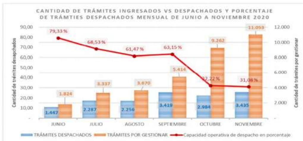
Figura 2: Trámites ingresados versus capacidad operativa (trámites despachados)

Adicionalmente, la capacidad operativa para el despacho de trámites catastrales se ha visto mermada, debido al incremento significativo de la demanda, así como a la limitación de recurso humano que permita atender todos los pedidos oportunamente, como lo muestra la Figura 2: