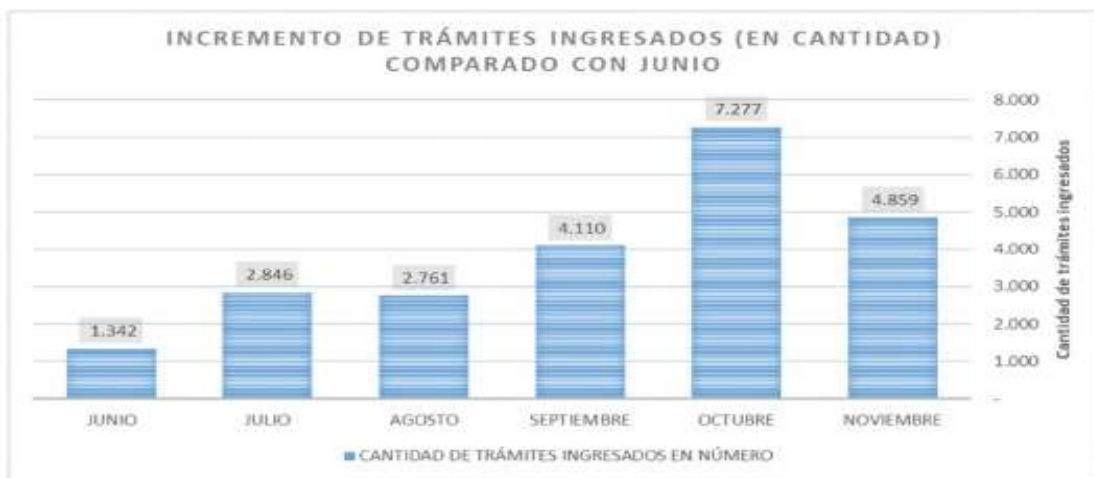
Figura 1: Incremento de trámites catastrales

Adicionalmente, la capacidad operativa para el despacho de trámites catastrales se ha visto mermada, debido al incremento significativo de la demanda, así como a la limitación de recurso humano que permita atender todos los pedidos oportunamente, como lo muestra la Figura 2: