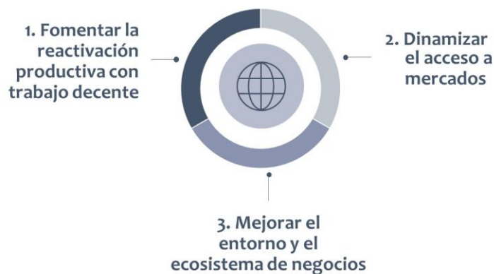
Gráfico 1. Ejes de reactivación productiva. Fuente: Plan de reactivación económica del CHQ. Elaboración: SDPC.