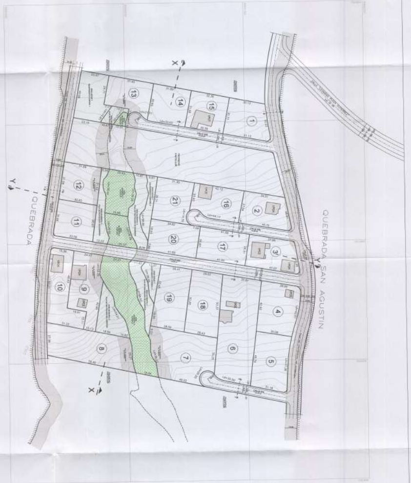
IMPLANTACIÓN GENERAL ESCALA 1:1000