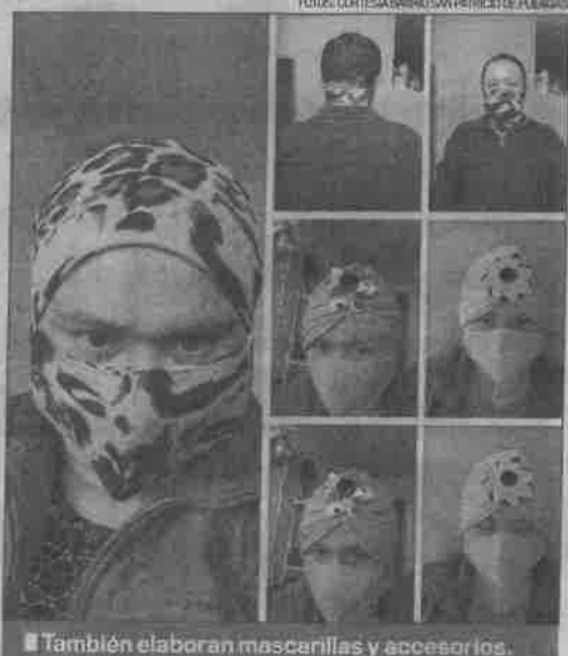
■ También elaboran mascarillas y accesorios.