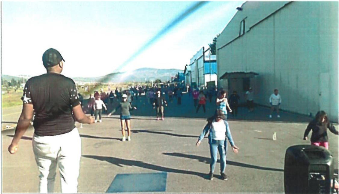
Anexo 5. Usuarios que practican yoga junto a la pista de bailoterapia