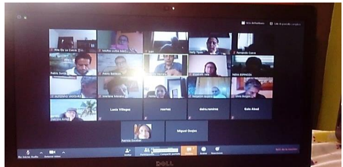
Reunión coordinación con rectores