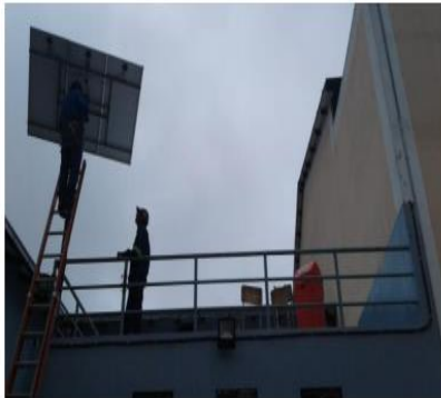
Figura 1. Instalación Modulo fotovoltaico