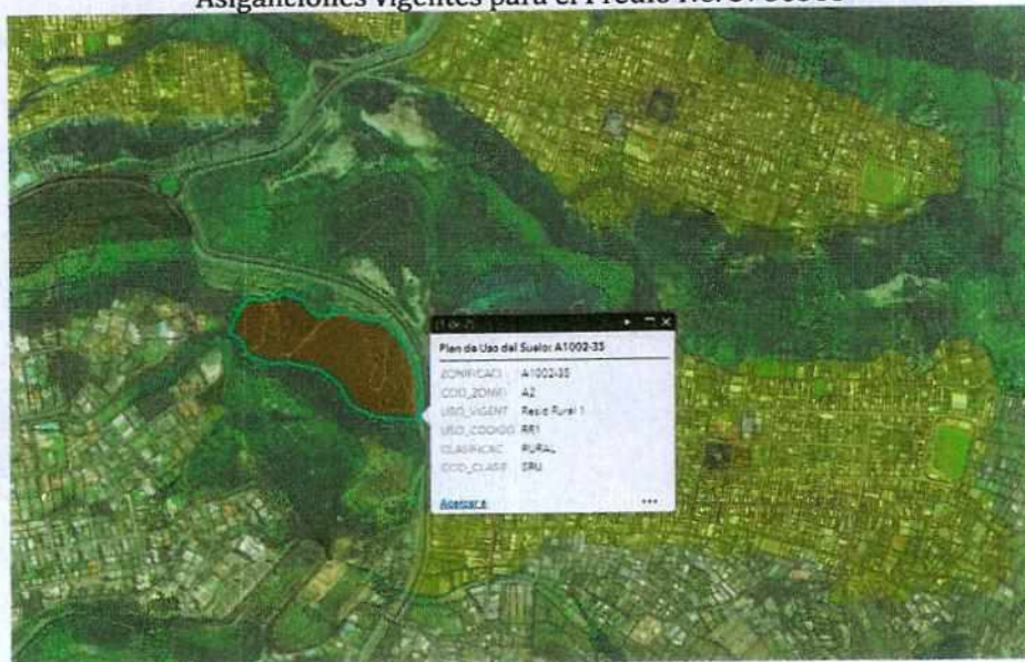
Asignaciones vigentes para el Predio No. 5786585