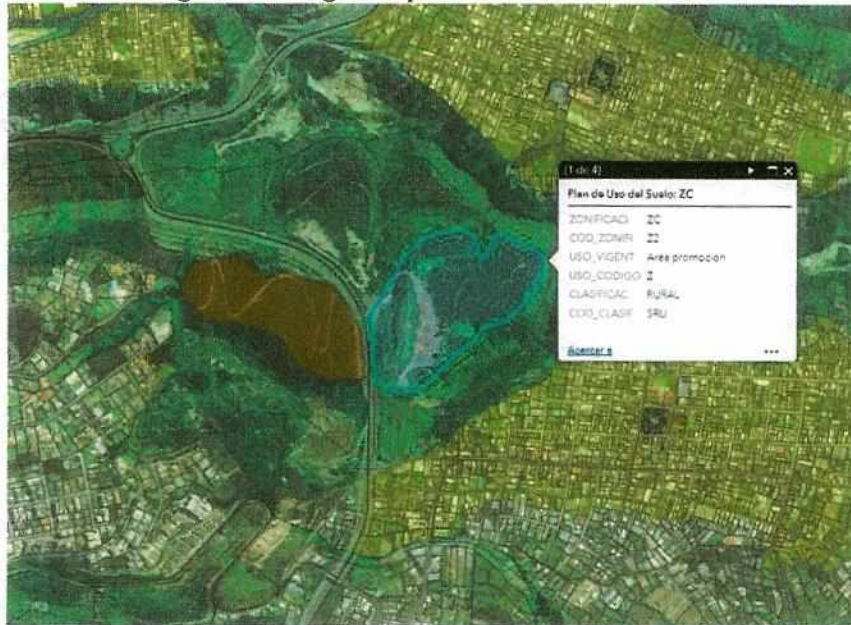
Asignaciones vigentes para el Predio No. 5786586