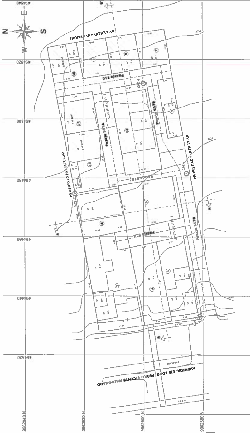
CUADRO DE ÁREAS Y LINDEROS