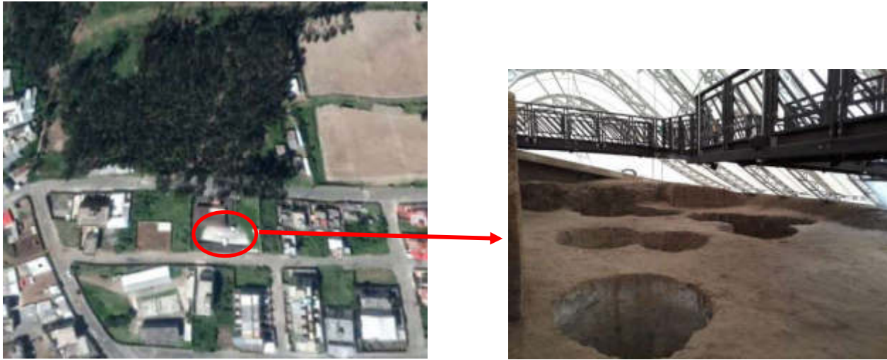
Fig. 3. Tumbas de pozo profundo en Museo de Sitio La Florida