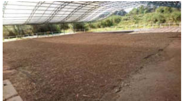
Fig. 2. Unidad 6 Parque Rumipamba

Así mismo, en el Museo de sitio La Florida ubicado en la calle Antonio Costas N52-104 entre Antonio Román y César Villacrés, Barrio San Vicente de La Florida.