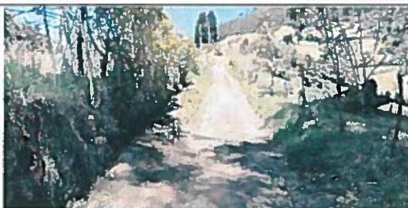
3.- Calle SN 16 de 4 5m de ancho.