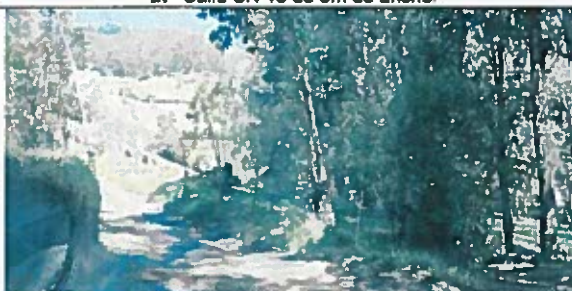
4.- a la izquierda ingreso a Calle SN 16 de 4 5m de ancho.