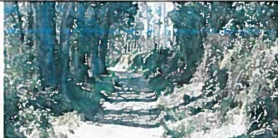
1.- Calle SN 15 de 5m de ancho.