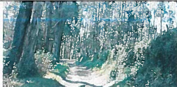
2.- Calle SN 15 de 5m de ancho.