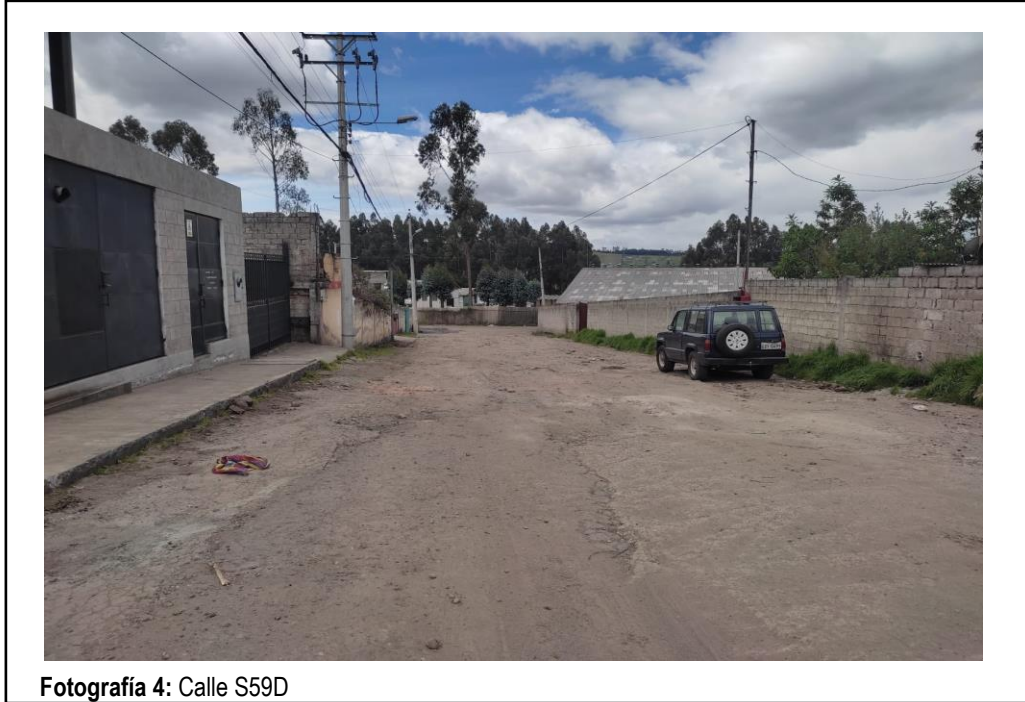
Fotografía 4: Calle S59D