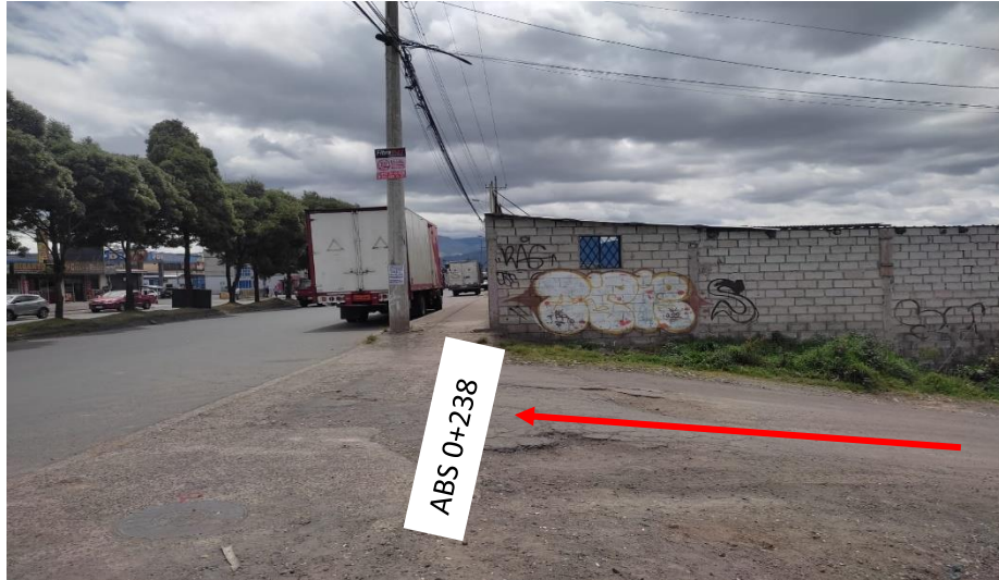
Fotografía 2: Calle S59D