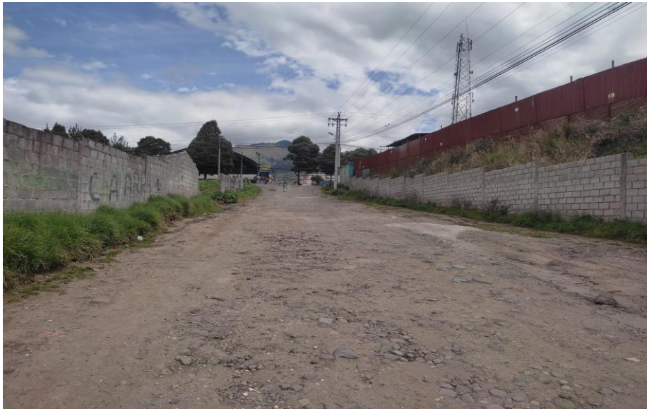
Fotografía 3: Calle S59D