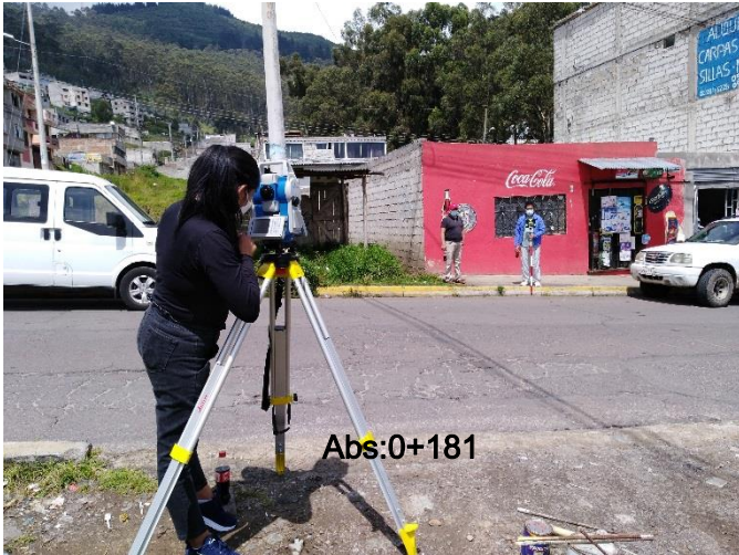
Intersección entre Calle Umiña y Angamarca