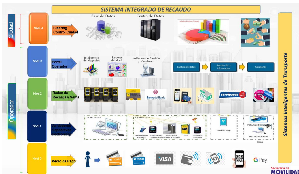
Imagen 3. Sistemas Inteligentes de Transporte

Los Sistemas Inteligentes de Transporte Constituyen herramientas tecnológicas de control, información, evaluación y recaudación del Sistema Metropolitano de Transporte Público de Pasajeros del DMQ, tales como, el Sistema Integrado de Recaudo (SIR), el Sistema de Ayuda a la Explotación (SAE) y el Sistema de Información al Usuario (SIU), que deberán ser implementados en los diferentes subsistemas, así como todos aquellos negocios colaterales que en virtud de la infraestructura implementada permitan mejorar la gestión, generen ingresos adicionales y beneficien al Usuario.