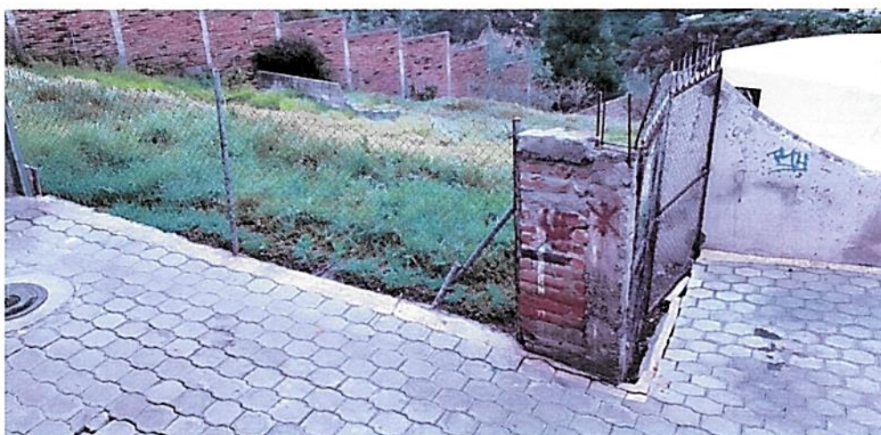
Fotografía Nro. 03