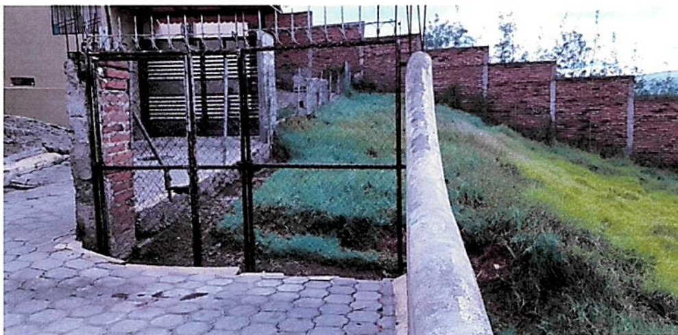
Fotografía Nro. 01