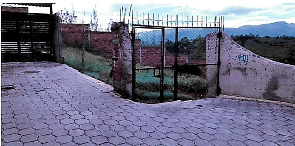
Fotografía Nro. 02