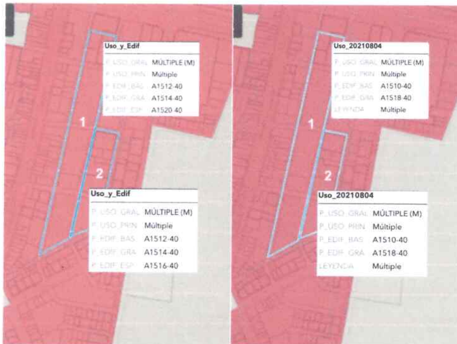
Gráfico No. 1- Polígonos con reducción en edificabilidad con diferentes asignaciones en el borrador del PUGS-junio 2021 y el PUGS-agosto 2021