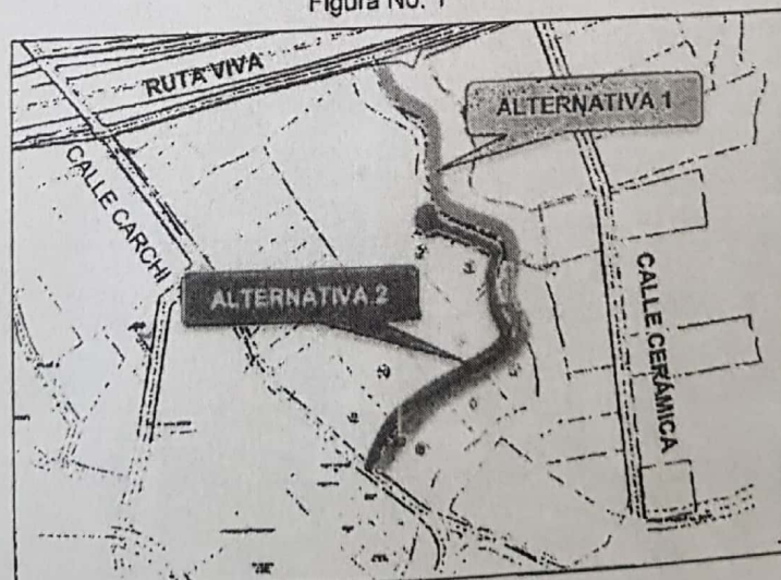
Figura No. 1