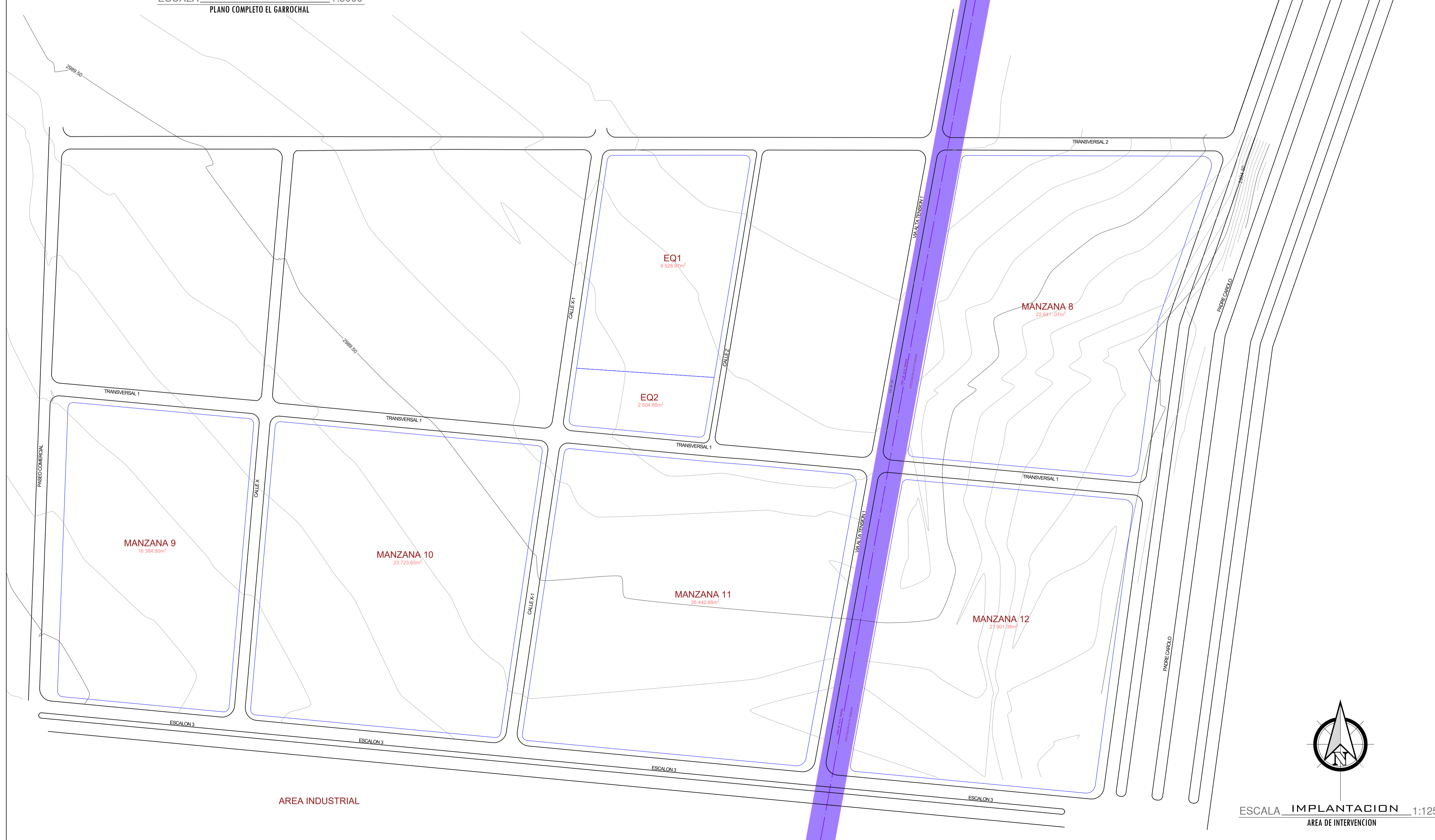
ESCALA IMPLANTACION 1:1250 AREA DE INTERVENCION