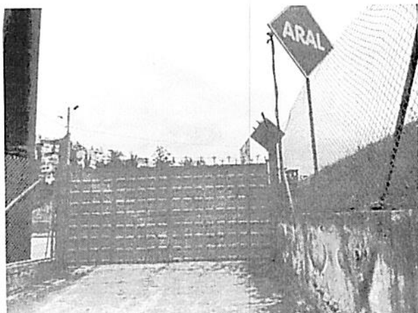
Imagen N°1: LOCAL CERRADO