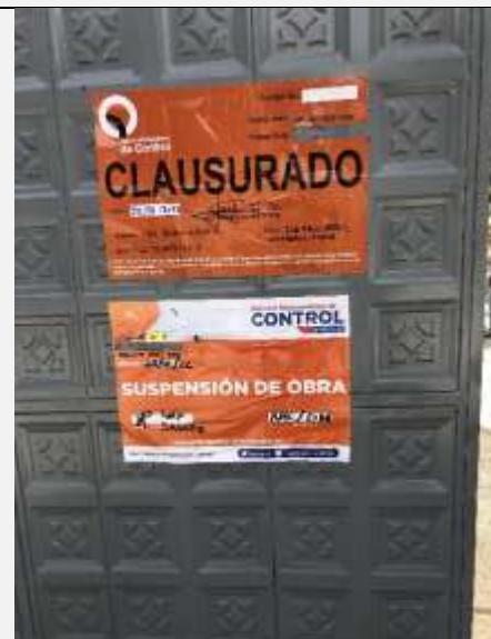
Imagen N° 8: Vista del sello de suspensión N° 2887-AMC colocado en el lugar.