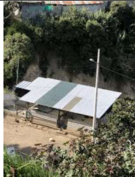
Imagen N° 2: Vista de construcción de 50 m2 al filo de la quebrada.