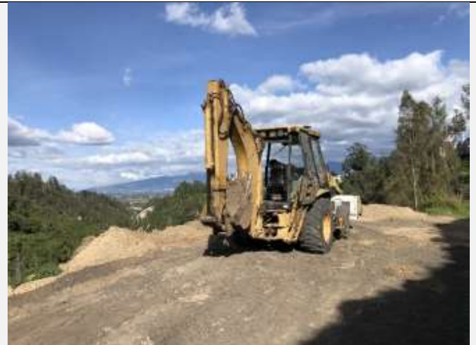
Imagen N° 4: Vista de los trabajos de movimiento de tierras que se estaban realizando al momento de la inspección sobre una faja de protección de quebradas.