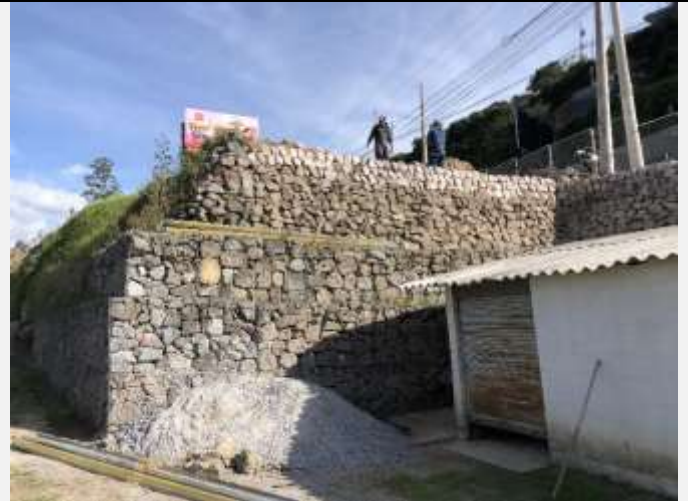
Imagen N° 6: Muro de piedra que estaba siendo construido al momento de la inspección. Se observa a los trabajadores en la parte superior.