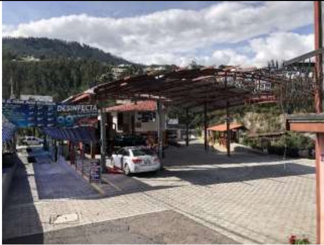
Imagen N° 1: Vista general del predio.