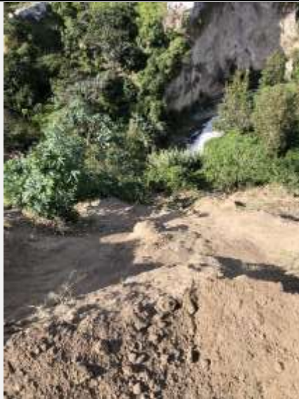
Imagen N° 5: Vista de la tierra que ha sido depositada sobre la quebrada.