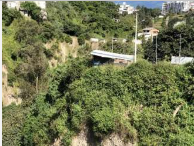
Imagen N° 3: Vista desde el puente del río Machángara de la construcción de 50 m2 que ha sido construida al filo de la quebrada.