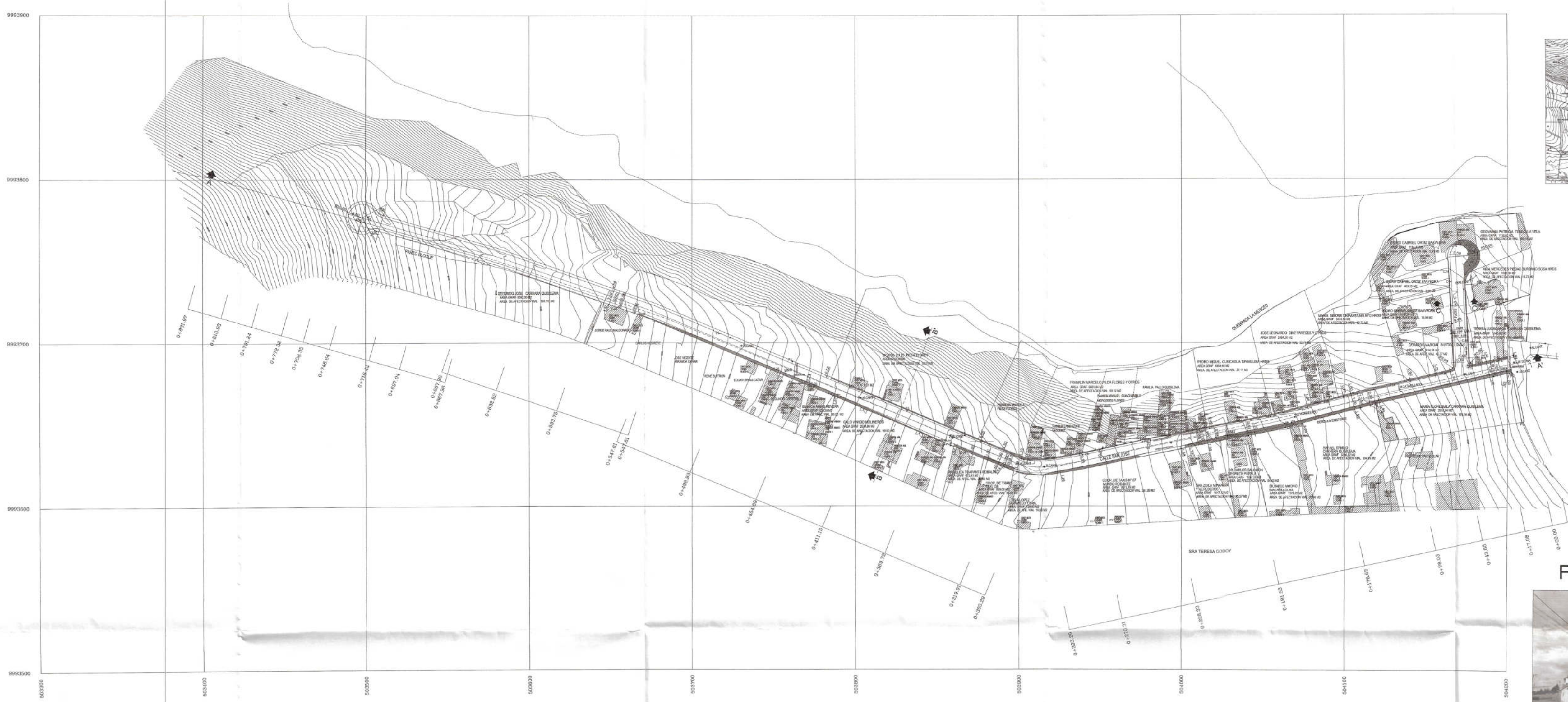
IMPLANTACION GENERAL ESCALA 1:1000