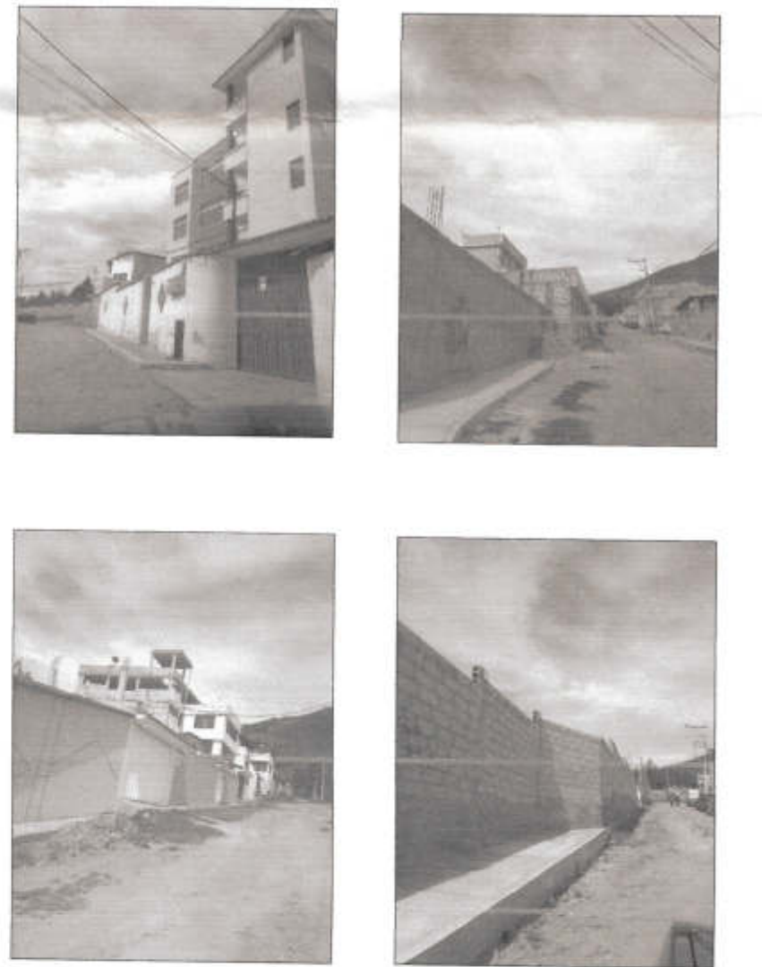
FOTOS ESTADO ACTUAL