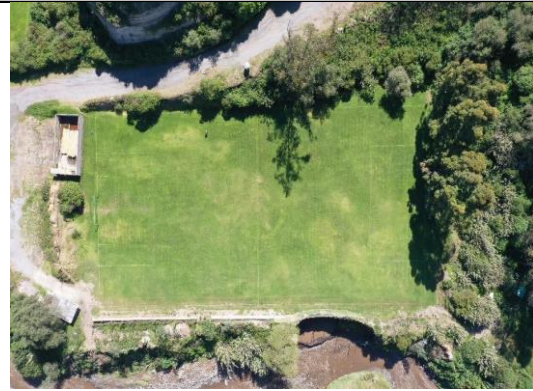
Imagen N° 2: Vista externa del estado actual.