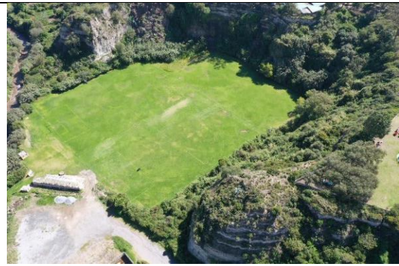
Imagen N° 10: Vista externa del estado actual.