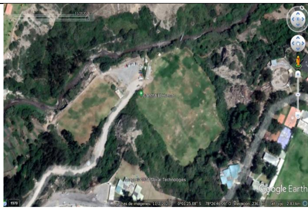
Imagen N° 14: Imagen histórica del estado del predio en el año 2020.