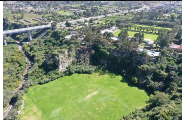
Imagen N° 5: Vista externa del estado actual.