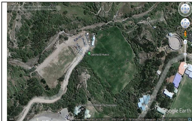
Imagen N° 13: Imagen histórica del estado del predio en el año 2013.