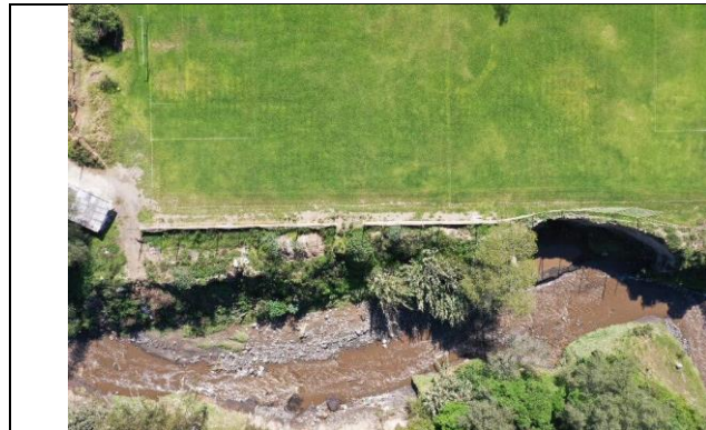
Imagen N° 7: Vista externa del estado actual.