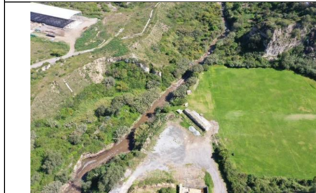
Imagen N° 9: Vista externa del estado actual.