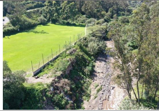
Imagen N° 6: Vista externa del estado actual.