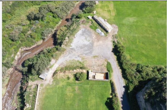
Imagen N° 3: Vista externa del estado actual.