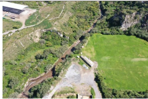
Imagen N° 8: Vista externa del estado actual.