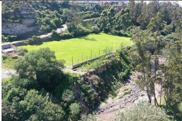
Imagen N° 1: Vista general del predio.