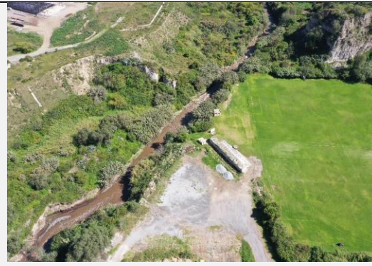
Imagen N° 4: Vista externa del estado actual.