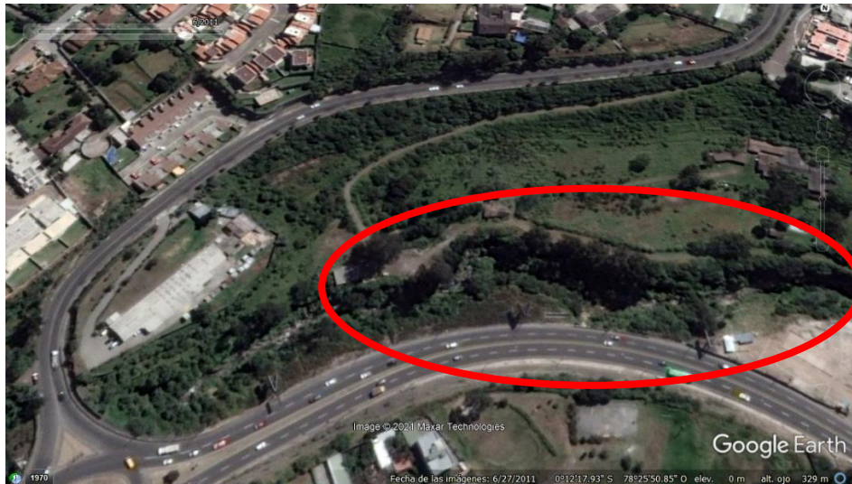
Ilustración 2. Imagen Satelital Google Earth Pro, 2011. Quebrada El Tejar, sección abierta.