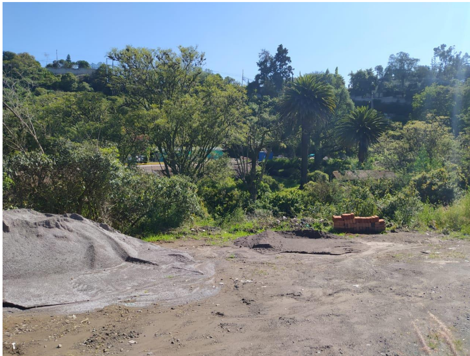
Ilustración 5. Material constructivo en el predio de Tomoraguadua S.A. adyacente al predio municipal.

Cómo se observa en las imágenes no existe una delimitación clara entre el predio de propiedad Municipal y el predio de Tomoraguadua, es decir, no se evidencia puntos referenciales de delimitación lo que dificulta que se tenga una claridad de una real afectación al predio municipal sea directa o indirectamente, adicional se observa que el predio se encuentra a desnivel uno del otro, siendo el predio de Tomoraguadua con cota superior.