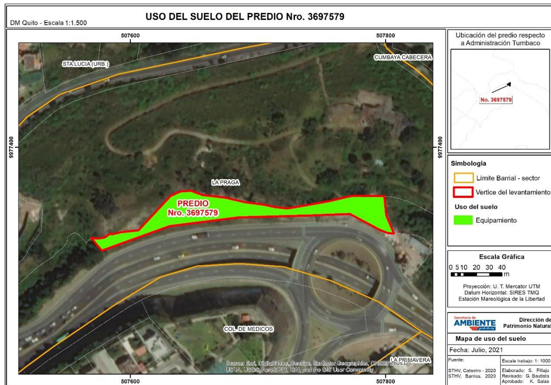
Ilustración 7. Usos del suelo del predio de acuerdo al Plan de Uso y Ocupación del Suelo PUOS del DMQ.