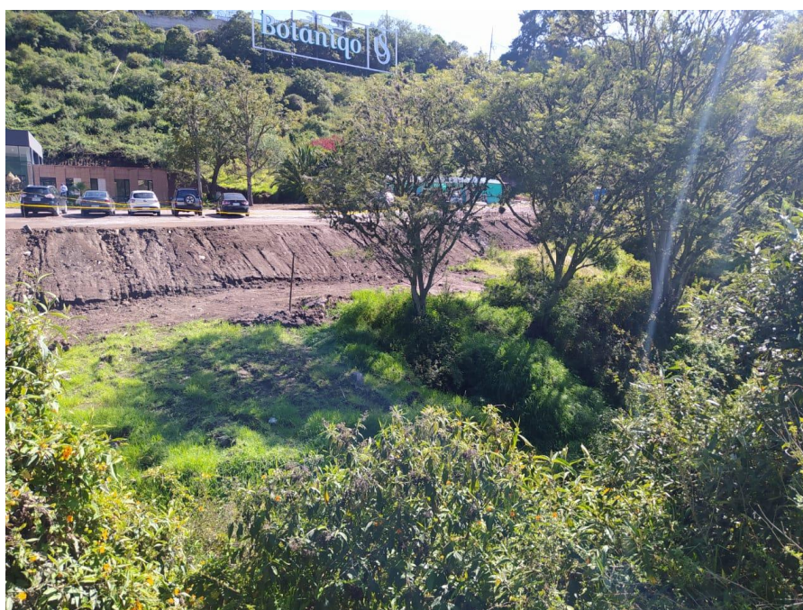
Ilustración 4. Vista del predio Municipal desde la Av. Oswaldo Guayasamín

Actualmente, el predio se encuentra sin infraestructura emplazada, cuenta con un cerramiento de postes de madera y alambre de púas deteriorado, adicionalmente tiene una afectación directa respecto a residuos de materiales constructivos sobre todo áridos y pétreos como ripio de los trabajos en el predio de propiedad de Tomoraguadua S.A., como se muestra en las siguientes imágenes: