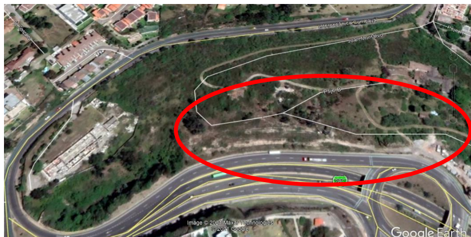
Ilustración 3. Imagen Satelital Google Earth Pro, 2021. Quebrada El Tejar, sección rellena.

Cómo se observa en la ilustración 4, el uso de suelo actual equipamiento A10 (A604-50) del predio irrumpe con la continuidad de la sección de quebrada abierta de El Tejar, siendo esta de zonificación A31 (PQ), como se muestra en el siguiente mapa, teniendo en color celeste la zonificación A31 (PQ) y la sección de uso de equipamiento en naranja del predio municipal: