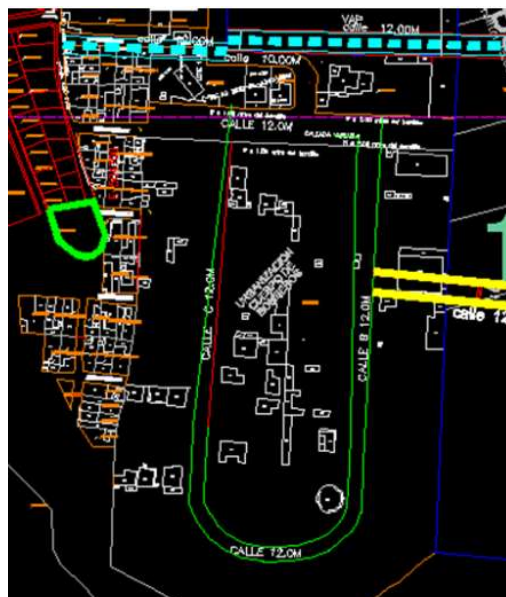
Imagen 7: Vías Aprobadas del PPC