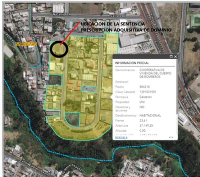
Imagen 6 : Vista satelital Predio