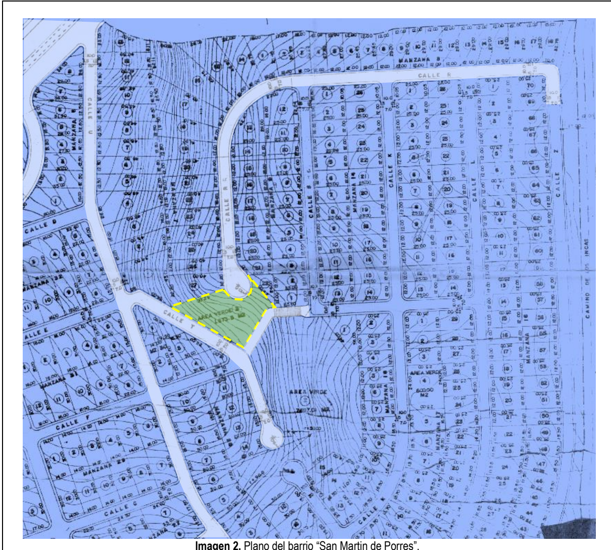
Imagen 2. Plano del barrio “San Martín de Porres”.

De acuerdo al plano del barrio “San Martín de Porres”, aprobado mediante Informe de Concejo Metropolitano de Quito Nro. 1061 de fecha 10 de junio de 1987, la calle R (E9) termina en curva de retorno y colinda con área verde municipal.