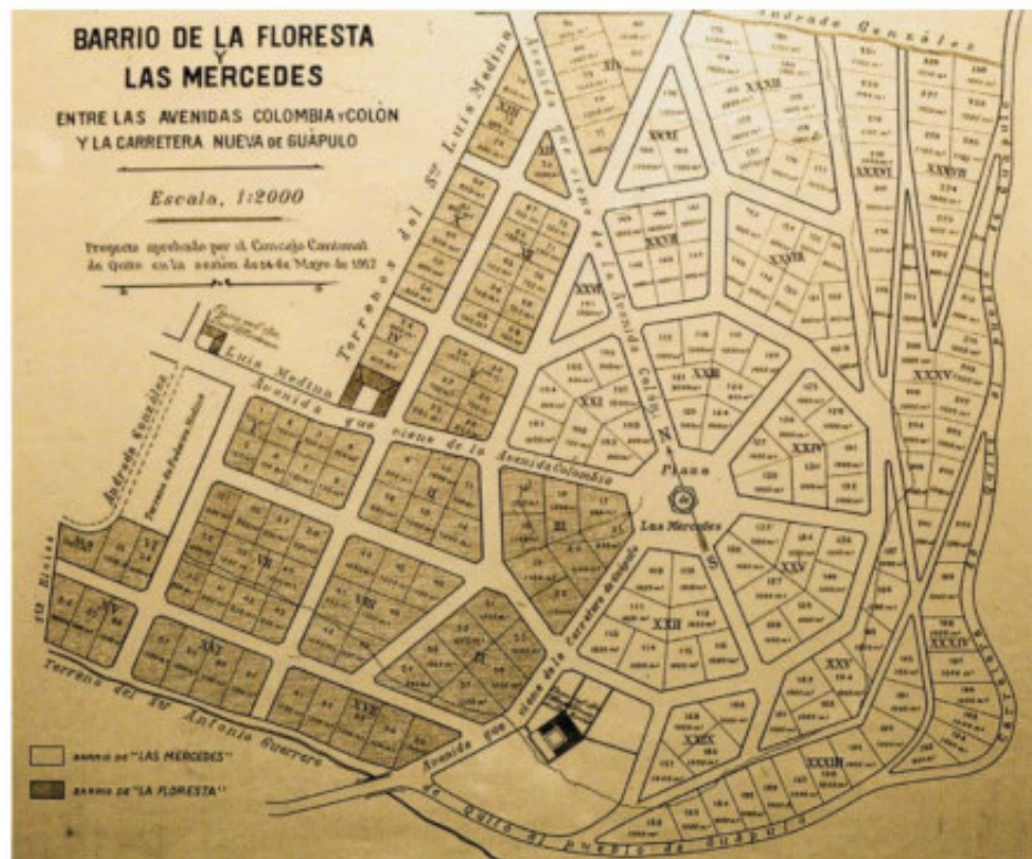
Figura 4. Delimitación del Barrio La Floresta (histórico)

El Concejo Cantonal de Quito aprobó el proyecto de delimitación del barrio de La Floresta mediante la sesión realizada el 24 de mayo de 1917 (Figura 4), lo cual es un antecedente histórico que demuestra que el límite de este barrio al sur era la carretera de Quito al pueblo de Guápulo hoy conocida como Avenida De Los Conquistadores.