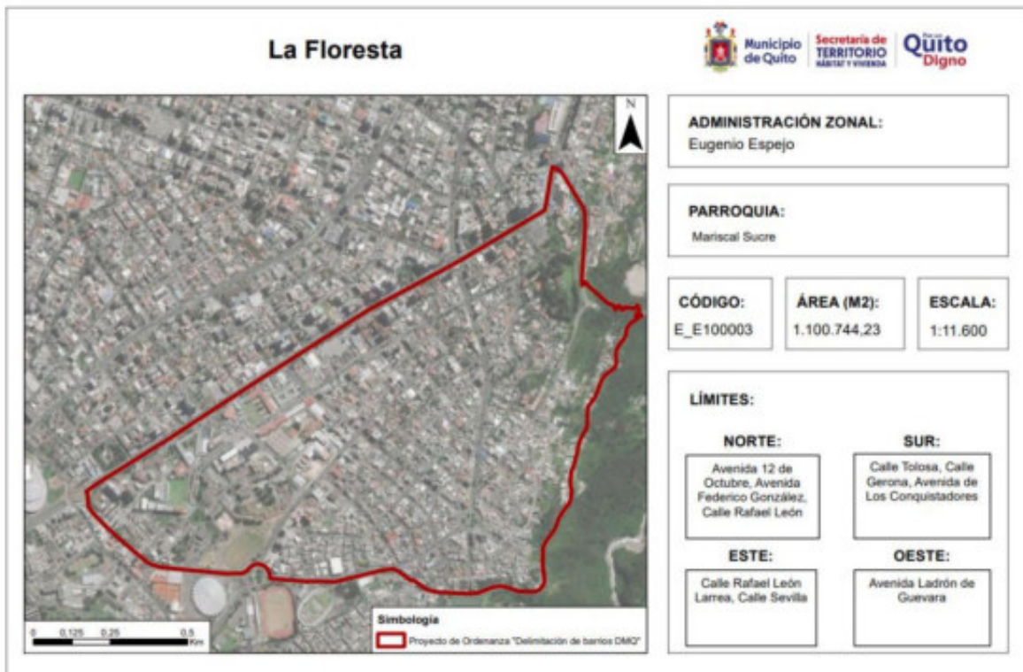
Figura 5. Redelimitación Barrio La Floresta