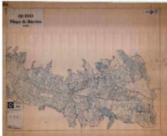
Figura 3: Plano de barrios de 1995

La información proporcionada por la Dirección Metropolitana de Gestión Documental y Archivos (DMGDA), corresponde a los planos históricos (Figura 3) que permitieron acceder a datos vinculados a la historia en la delimitación de barrios, así como en las ordenanzas existentes.