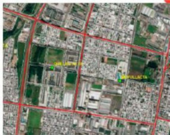
Figura 2: Insumo Predial para la delimitación de barrios

La información catastral con corte enero 2020 (Figura 2), se utilizó como referencia para la delimitación de barrios en el sector urbano. La información proporcionada por la Dirección Metropolitana de Catastro (DMC) tiene una escala 1: 1 000 para el área urbana y 1: 5 000 para el área rural. Por otra parte, se tomó como referencia la información temática del catastro rural del proyecto SIGTIERRAS para las zonas rurales del DMQ.