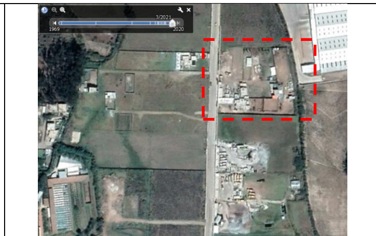
Imagen N°7: Imagen satelital de la parte posterior del predio con fecha marzo de 2021. Se encuentran señaladas las partes del predio donde se han realizado construcciones

Iván Salvador, arquitecto Inspector Técnico Dirección de Inspección, AMC