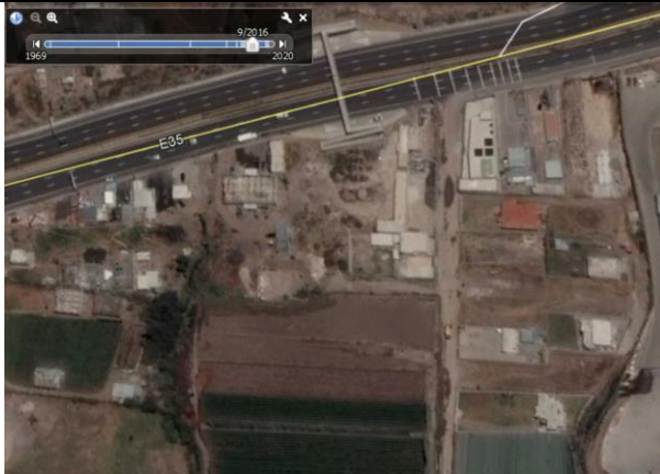
Imagen N°5: Imagen satelital de la parte frontal del predio con fecha octubre de 2016