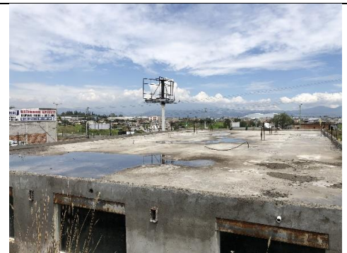
Imagen N°4: Vista de una de las edificaciones construidas en los últimos 5 años sin los permisos correspondientes.