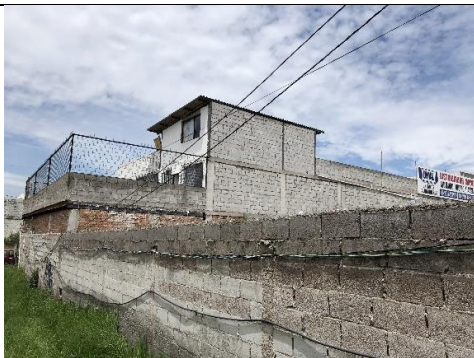
Imagen N°3: Vista de una de las edificaciones construidas en los últimos 5 años sin los permisos correspondientes.