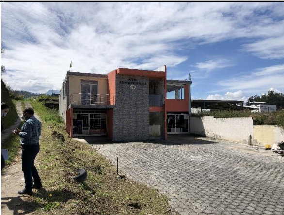
Imagen N°1: Vista de una de las edificaciones construidas en los últimos 5 años sin los permisos correspondientes.