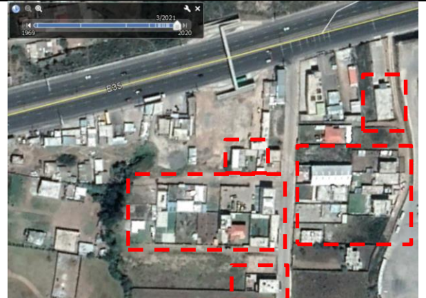
Imagen N°6: Imagen satelital de la parte frontal del predio con fecha marzo de 2021. Se encuentran señaladas las partes del predio donde se han realizado construcciones