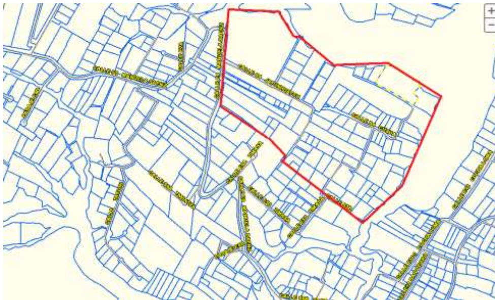
Gráfico 2: Segundo rango de consideración de influencia