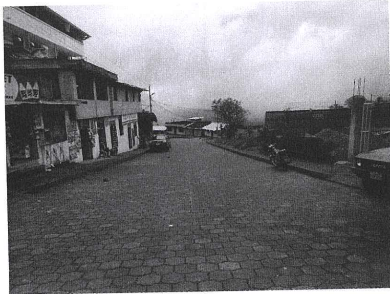
Vía a Nanegal