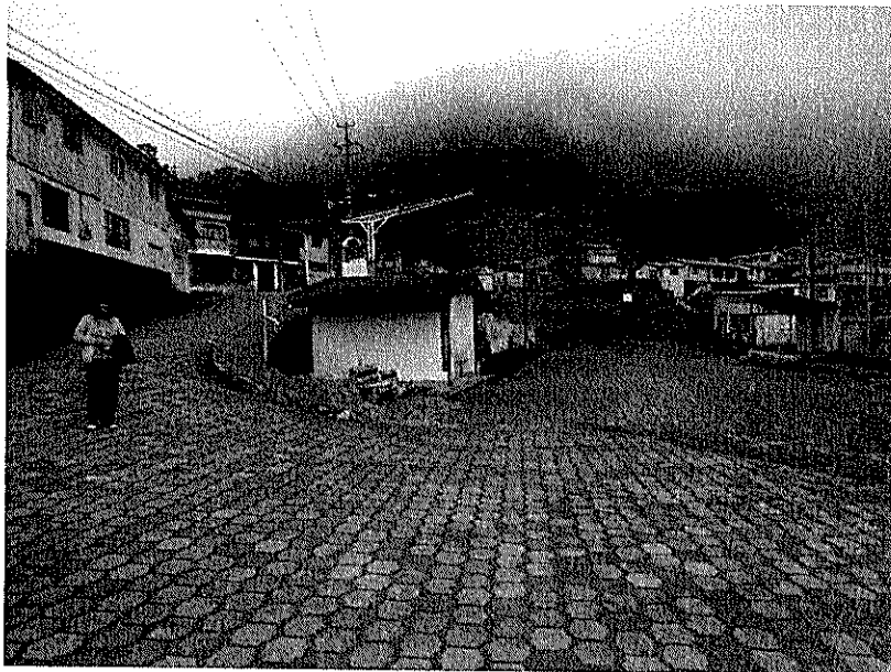
Calle Eugenio Espejo y S/N 3