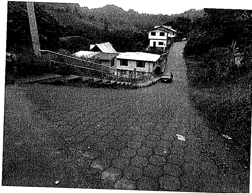
Pasaje Los Sauces