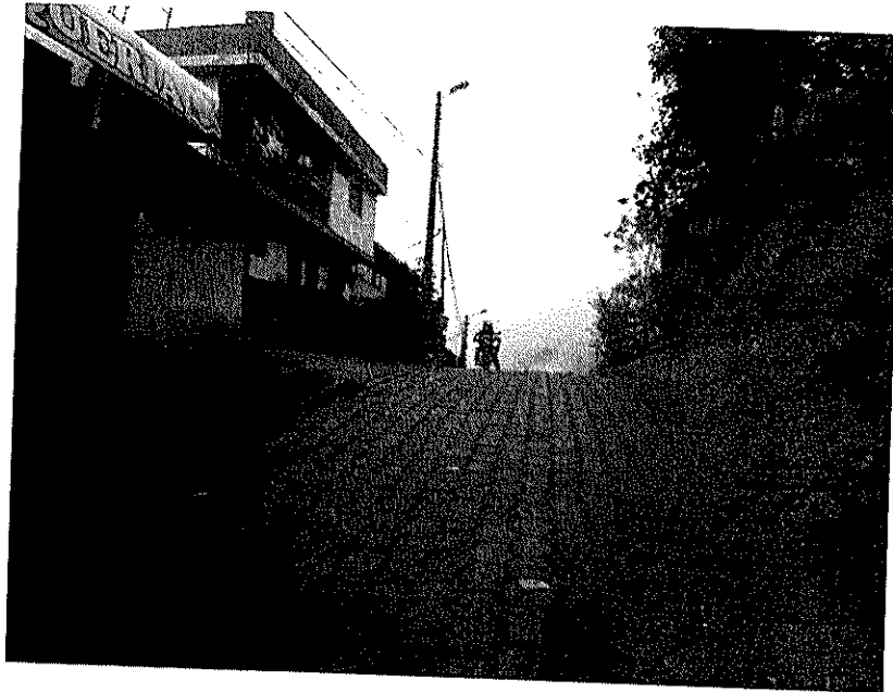
Pasaje S/N 4