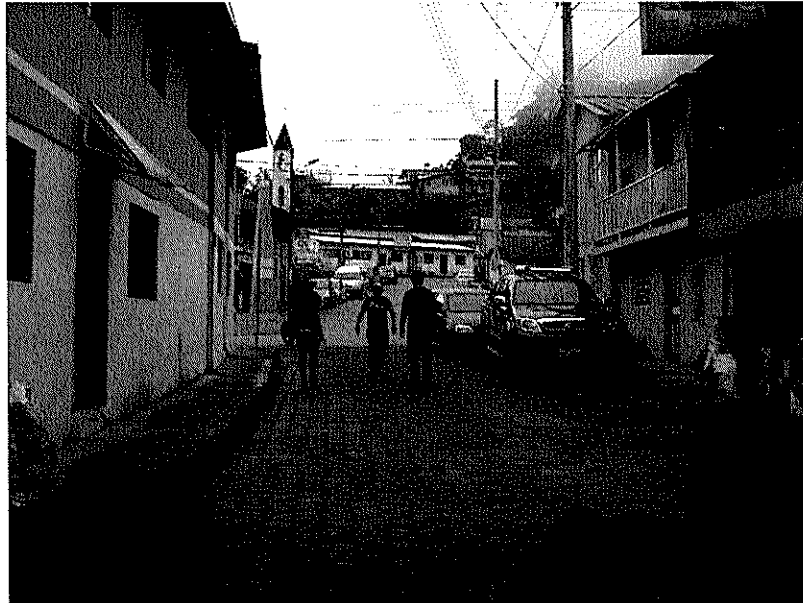
Calle Pichincha y calle S/N 2