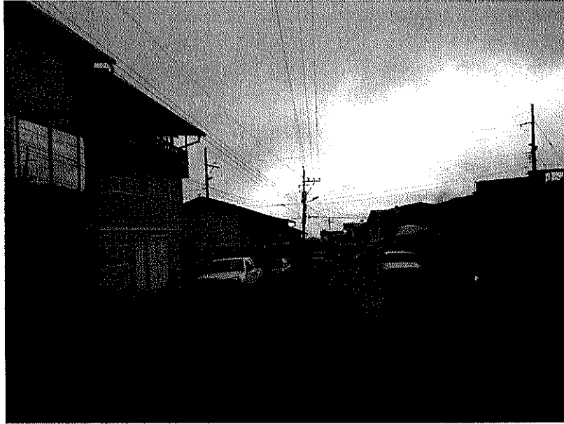
Calle S/N 1