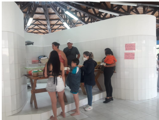
Imagen No 5: Grupos de atención prioritaria de procesos de inclusión social: jóvenes, mujeres madres solteras y personas de movilidad humana