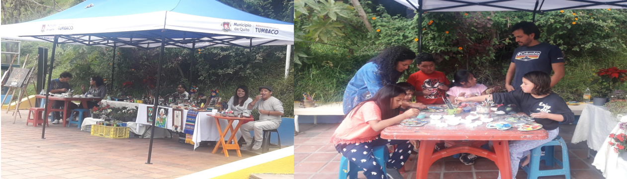
Imagen No 3: Artesanos y Gestores Culturales