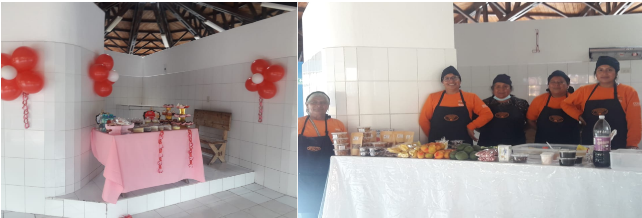
Imagen No 4: Emprendedores de Casa Somos – Emprendedores de UPAS-CONQUITO – Zona Tumbaco