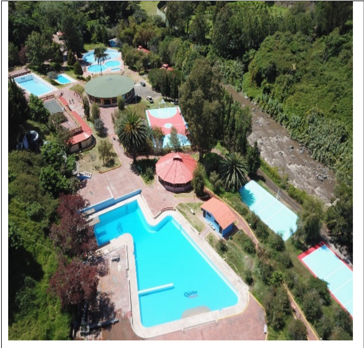
Imagen No 1: Vista general del Balneario de Cununyacu

Con fecha sábado 11 de febrero del 2023, se realizó la inauguración del Balneario Cununyacu, y desde el domingo 12 de febrero del presente año se realizó su reapertura para el uso de todos los Quiteños.