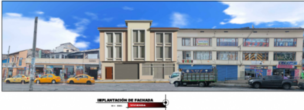
Imagen 1: Propuesta de fachadas/ integración.

La distribución funcional, se propone de la siguiente manera: