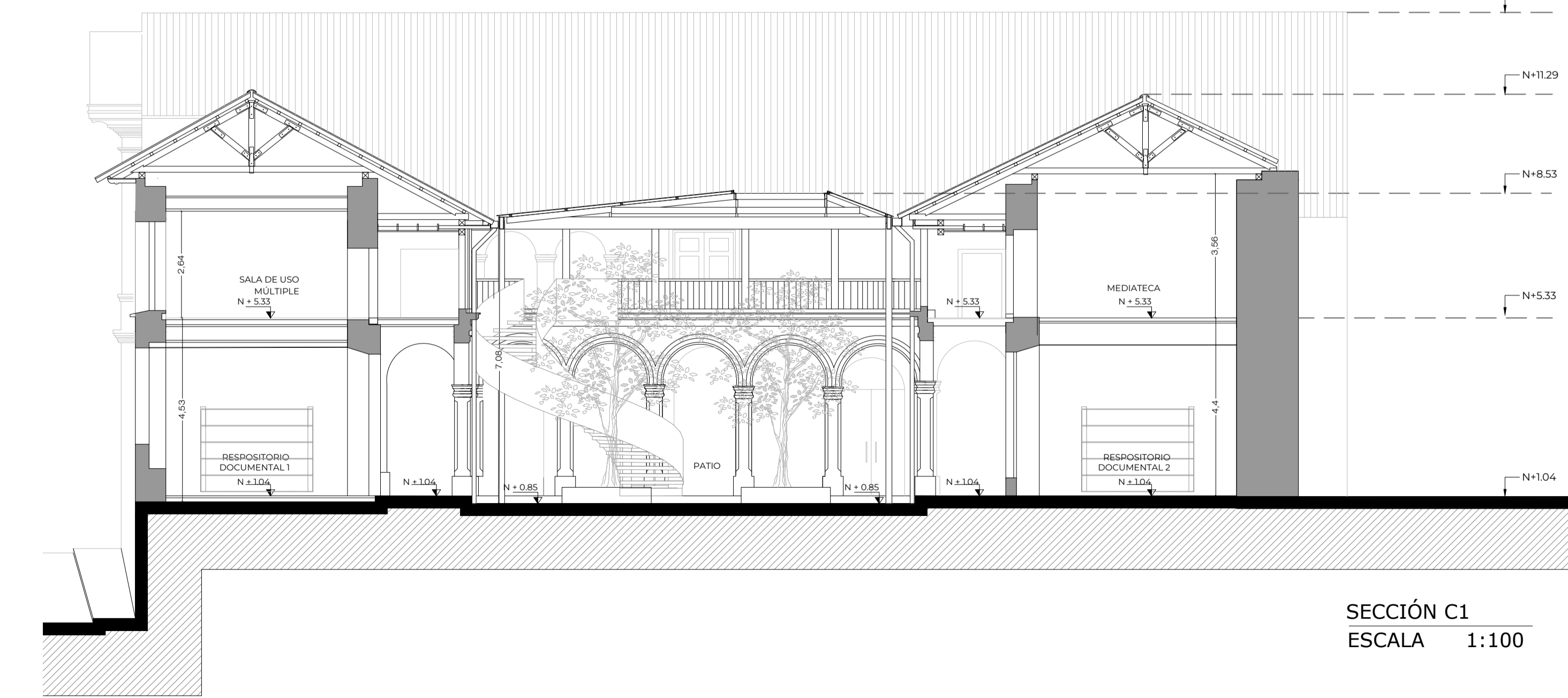
SECCIÓN C1 ESCALA 1:100