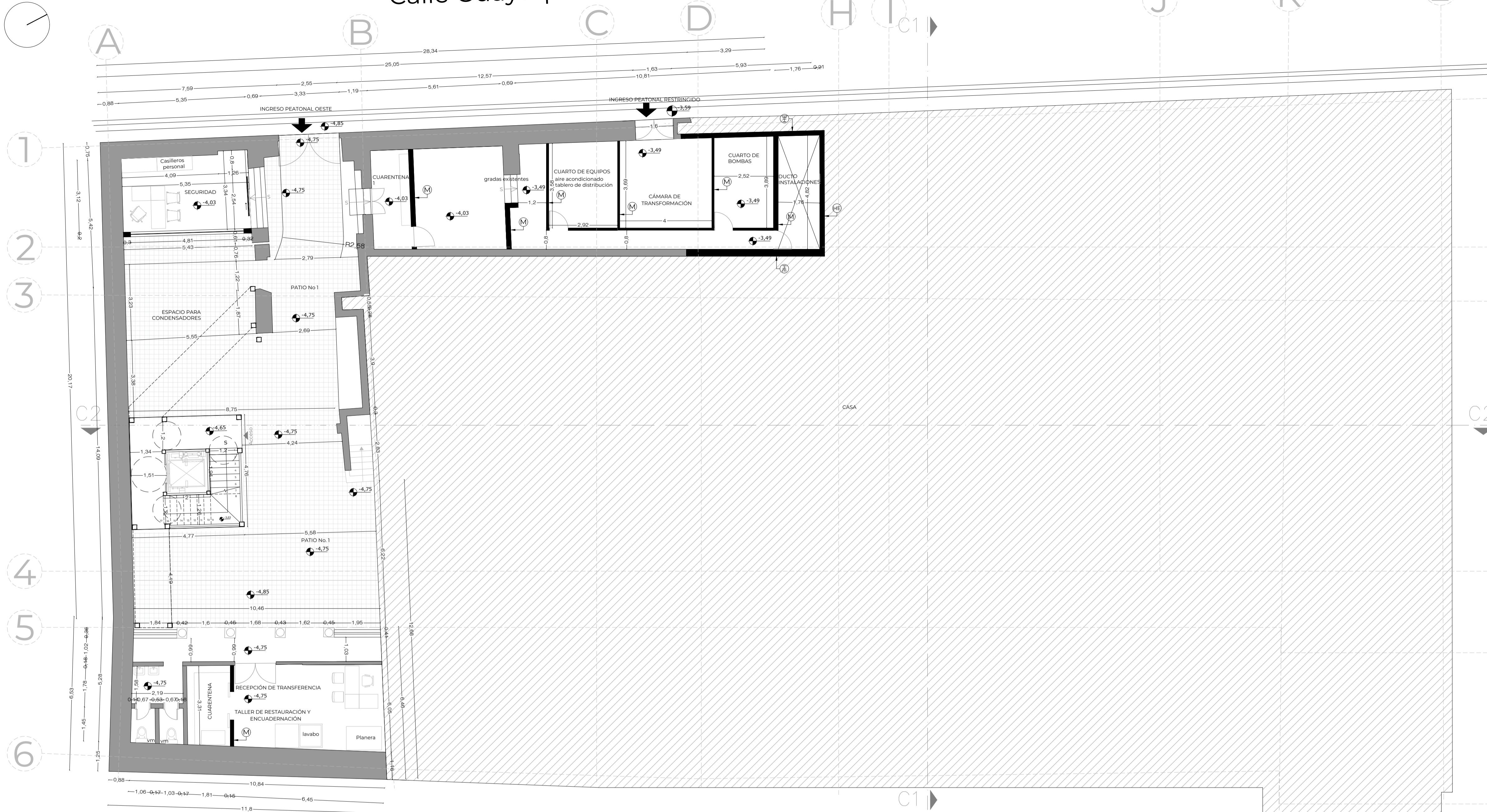
SUBSUELO ESC. 1:100