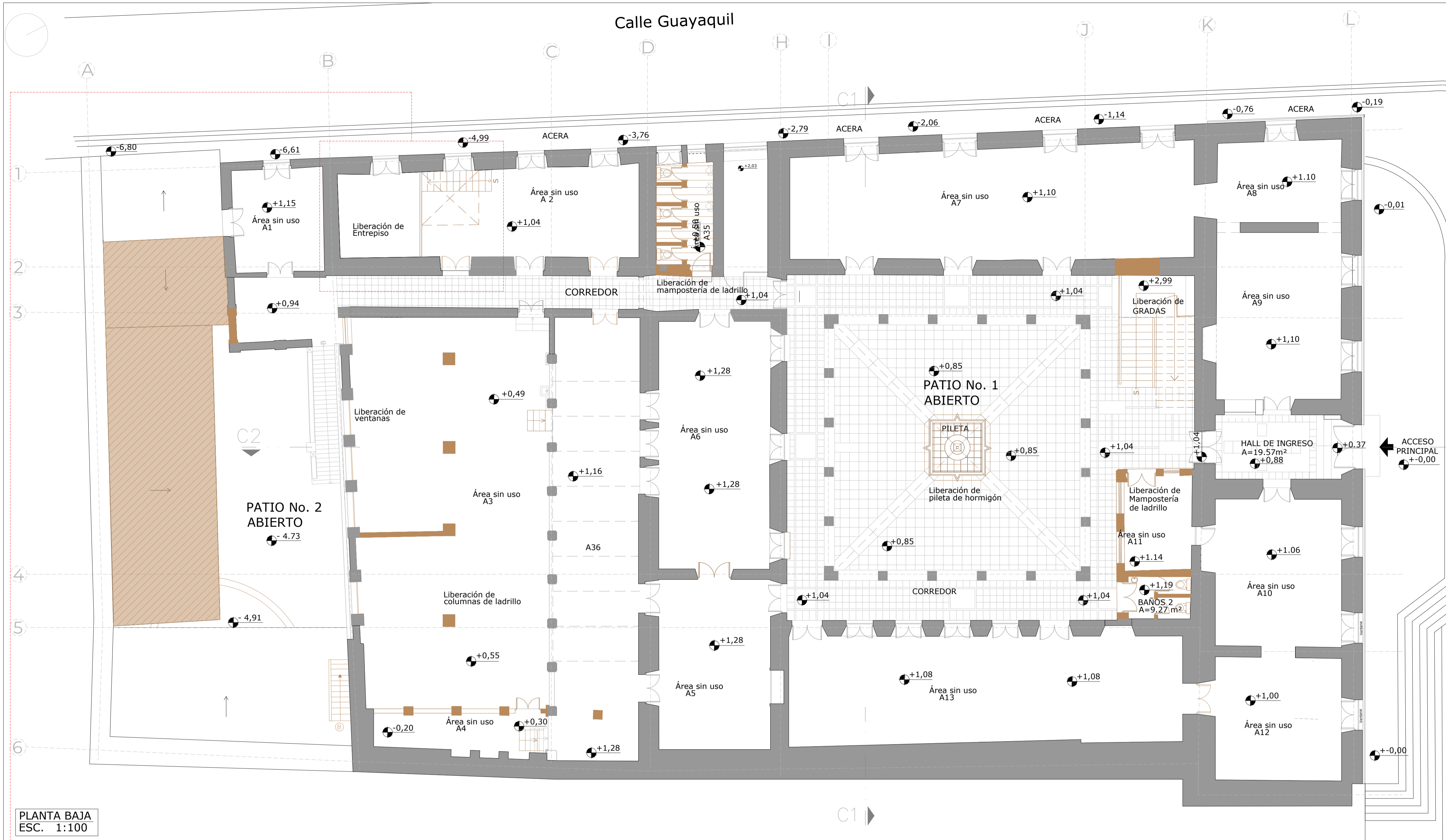
PLANTA BAJA ESC. 1:100