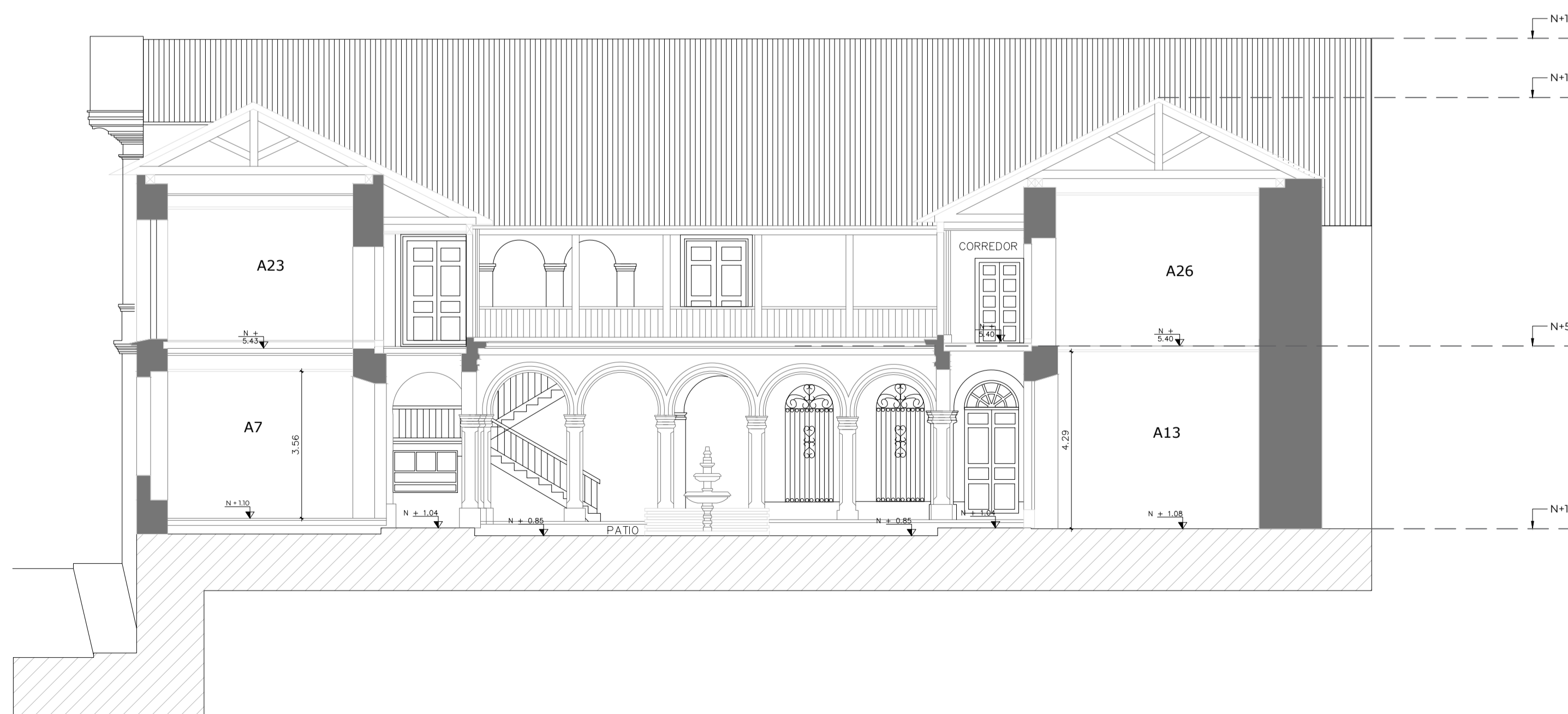
SECCIÓN C1 ESCALA 1:100