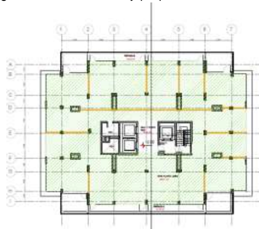
Imagen 11. Estado Actual – Piso 5.