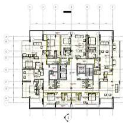
Imagen 6. Planta piso 6.