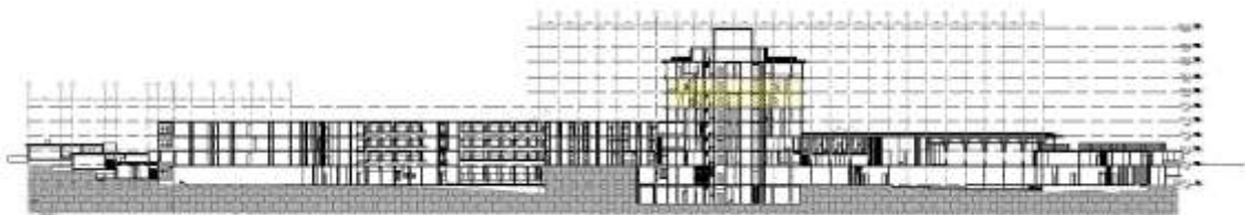
Imagen 8. Composición Formal.