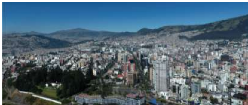
Imagen 3. Vista aérea Hotel Quito.

Conforme se puede observar en las siguientes imágenes, el inmueble a intervenir, está implantado en un entorno urbano heterogéneo, presenta diferencias respecto a la altura de edificaciones y tipología constructiva.