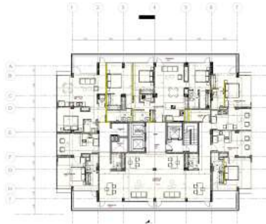
Imagen 12. Propuesta – Piso 5.