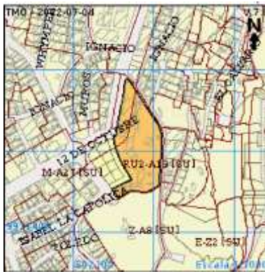
Imagen 1. Ubicación.

En cuanto a la morfología del área de estudio, la forma de manzana predominante es regular con forma de damero adaptada a la topografía del lugar.