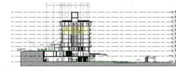
Imagen 9. Composición Formal.