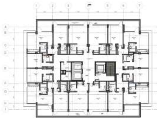
Imagen 10. Estado Original – Piso 5.