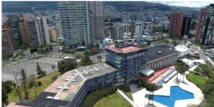
Imagen 4. Vista aérea Hotel Quito.