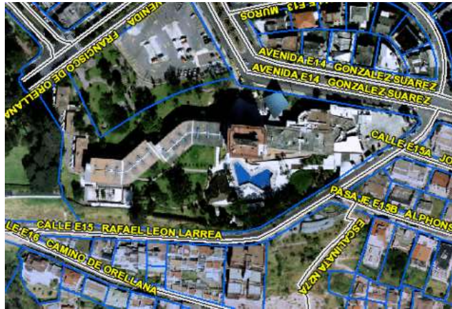
Imagen 7. Implantación Hotel Quito.