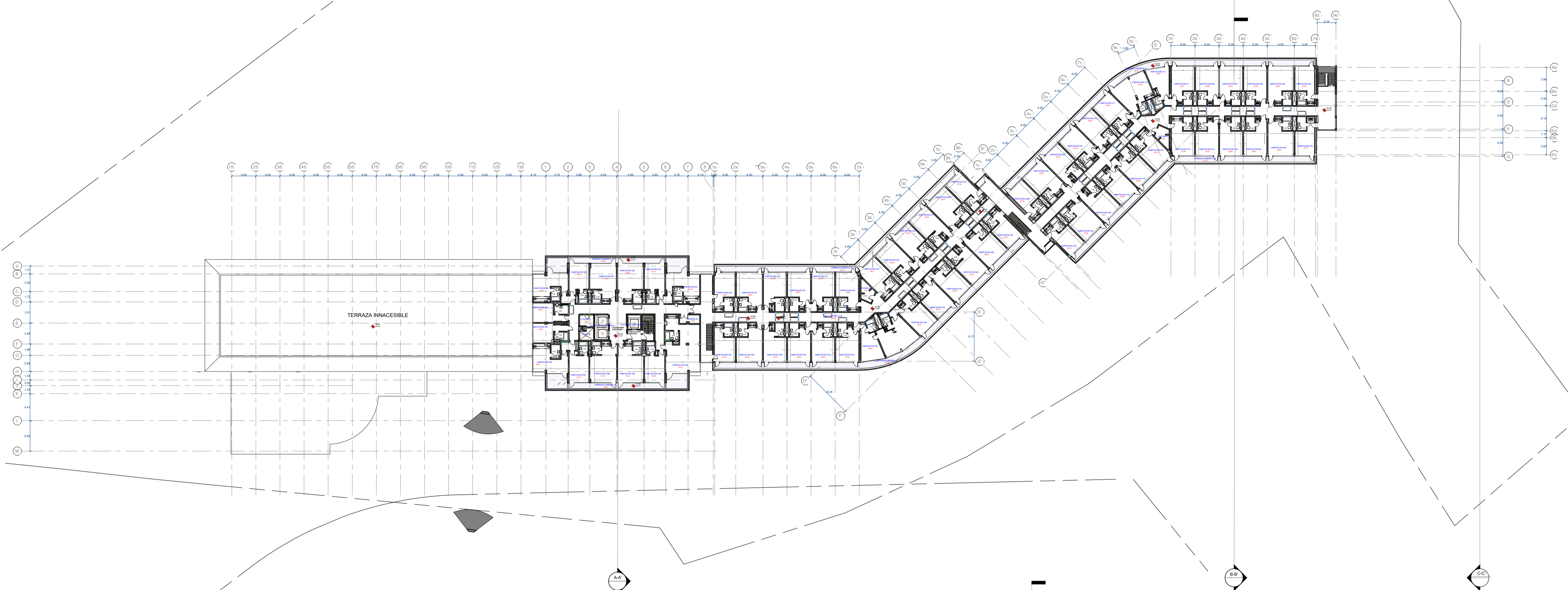
1 PISO 3 1 : 250